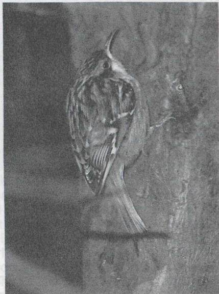
46 Tree creeper Certhia familiaris , Wieringerwerf, Noordholland, January 1987 (Arnoud B van den Berg) 47 Short-toed Tree creeper C brachydactyla , Alphen aan den Rijn, Zuidholland, February 1987 (Arie de Knijff)

23 Mystery photograph 23 obviously shows a tree creeper Certhia . The two species occurring in the western Palearctic are difficult to separate, the more so from photographs, when their characteristic calls can not be heard. The problem is made even more complicated by the geographical variation in plumage that one of them, the Tree creeper C familiaris , shows in Europe. Still, a correct identification should be possible from a good photograph like the one shown here. Useful differences between the two species can be found in the coloration of upperparts and underparts, the prominence of the supercilium and to a lesser extent in the length of hind claw and bill.