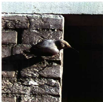
40-41 Rotskruiper Tichodroma muraria , Amsterdam-Buitenveldert, Noordholland, november 1989 (René Pop)