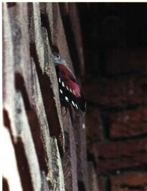
133-134 Rotskruiper Tichodroma muraria , Augustinusparochiekerk, Amsterdam-Buitenveldert, Noordholland, 31 maart 1990

april nog steeds een gedeelte van het winterkleed vertoont (Kees Roselaar pers med). Het is echter onwaarschijnlijk dat de Rotskruiper van Amsterdam in april 1990 nog in volledig winterkleed was. Het leek daarom waarschijnlijk dat de Amsterdamse vogel een vrouwtje betrof. Overigens vertoont c 60% van de vrouwtjes in zomerkleed eveneens een individueel variërende hoeveelheid zwart op de borst zodat bij aanwezigheid van zwarte borstveren een vrouwtje in zomerkleed niet uit te sluiten is; de hoeveelheid zwart is bij mannelijke exemplaren echter groter dan bij vrouwelijke (Löhr 1967).