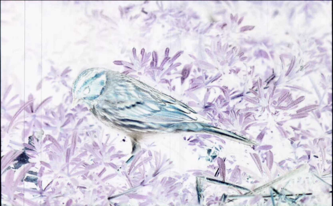
81 Little Bunting Emberiza pusilla , Katwijk aan Zee, Zuidholland, 5 April 1990