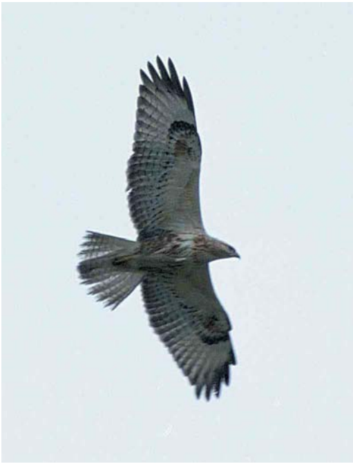
285 Long-legged Buzzard / Arendbuizerd Buteo rufinus , juvenile, Praamweg, Flevoland, Netherlands, 9 September 2000