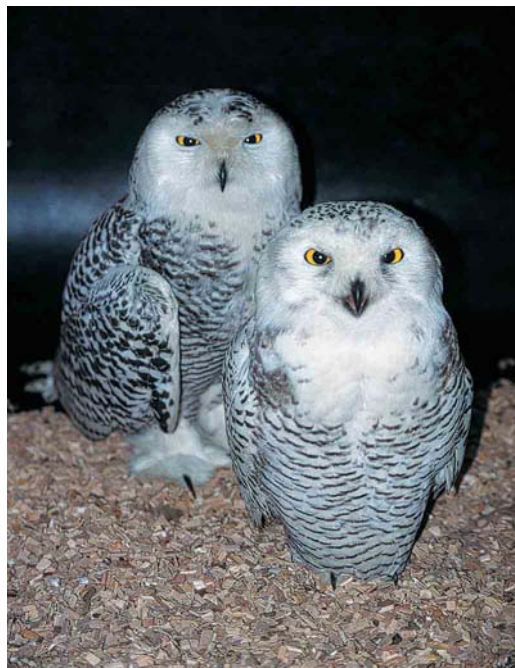
461 Sneeuwuilen / Snowy Owls Nyctea scandiaca (aan land gebracht te Eemshaven, Groningen, op 31 oktober 2001), eerste-winter vrouwtje (links) en eerste-winter mannetje (rechts), vogelopvangcentrum 'De Fûgelhelling', Ureterp, Friesland, 1 november 2001 (Petra van der Heide)

enkele pogingen worden gevangen door Jaap Poortvliet. De volgende dag is de vogel overgebracht naar het revalidatiecentrum 'De Mikke' in Middelburg, Zeeland. Een nieuwe, zeer licht besmeurde vogel werd op 29 oktober gezien in Aardenburg, Zeeland. Het is lastig na te gaan van welke schepen deze vogels afkomstig zijn. Voor de twee Nederlandse vogels zou dit de Menominee kunnen zijn, maar de mogelijkheid bestaat ook dat ze onopgemerkt zijn meegelift op de Federal Saguenay (die ook Terneuzen passeerde), of mogelijk zelfs nog een ander schip. Beide schepen hebben niet aangemeerd in Felixstowe, dus de Engelse vogel lijkt afkomstig te zijn van een ander schip.