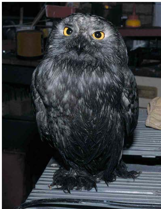
460 Sneeuwuif / Snowy Owl Nyctea scandiaca , vrouwtje, Terneuzen, Zeeland, 24 oktober 2001 (Alex Wieland)