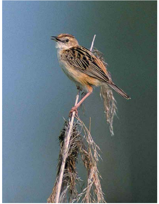
385 Dusky Warbler / Bruine Boszanger Phylloscopus fuscatus (right), with Northern Chiffchaff / Tjiftjaf P. collybita , Amsterdamse Waterleidingduinen, Zandvoort, Noord-Holland, 5 November 2000 386 Zitting Cisticola / Graszanger Cisticola juncidis , Ooltgensplaat, Zuid-Holland, 31 August 2000 387 Cetti's Warbler / Cetti's Zanger Cettia cetti , Bloemendaal, Noord-Holland, 17 September 2000