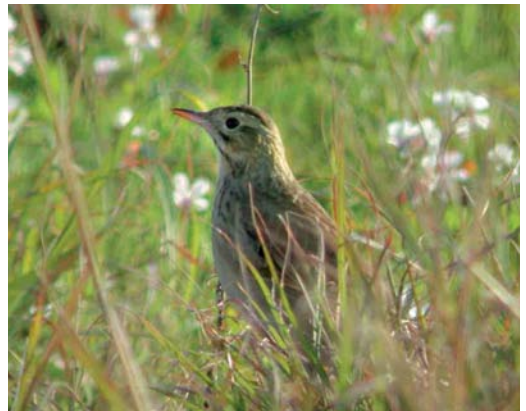
88 African Crake / Afrikaanse Kwartelkoning Crecopsis egregia , Tenerife, Canary Islands, November 2001 (Juan Antonio Lorenzo) 89 White-tailed Eagle / Zeearend Haliaeetus albicilla , first-winter, Circeo NP, Lazio, Italy, January 2002 (Marco Andreini) 90-91 Allen's Gallinule / Afrikaans Purperhoen Porphyryla alleni , Benidorm, Alacant, Spain, 26 February 2002 (Elias Gomis Martin) 92 Pallas's Gull / Reuzenzwartkopmeeuw Larus ichthyaeus , first-winter, Lentini lake, Siracusa, Sicily, Italy, 6 January 2002 (Andrea Corso) 93 Richard's Pipit / Grote Pieper Anthus richardi , adult, Siracusa, Sicily, Italy, 9 January 2002 (Andrea Corso)