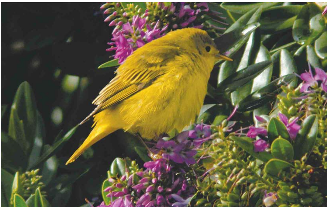
579 Yellow Warbler / Gele Zanger Dendroica petechia , Brevig, Barra, Outer Hebrides, Scotland, 4 October 2004 (Chris Batty)