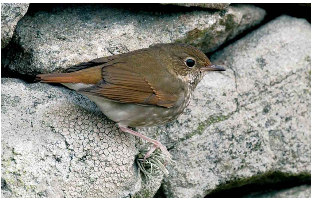
571 Rufous-tailed Robin / Snornachtegaal Luscinia sibilans , first-year, Fair Isle, Shetland, Scotland, 23 October 2004