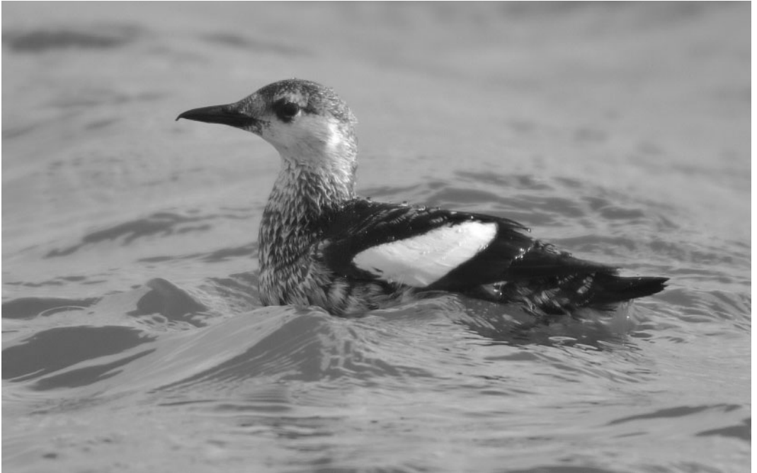
259 Zwarte Zeekoet / Black Guillemot Cepphus grylle , adult, NIOZ-haven, Texel, Noord-Holland, 6 maart 2006