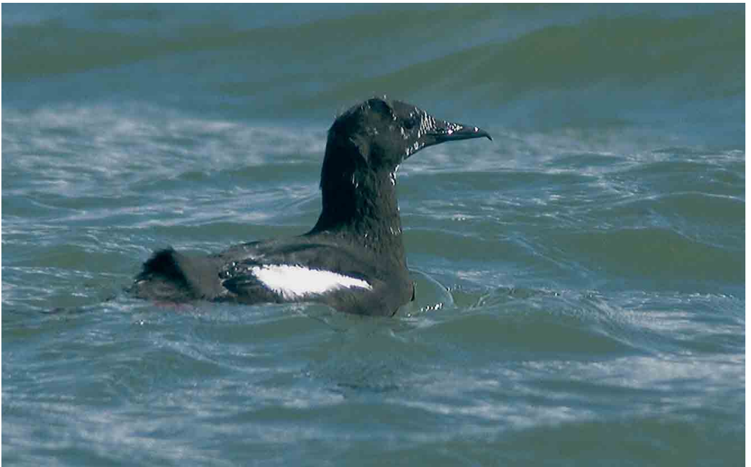
260 Zwarte Zeekoet / Black Guillemot Cepphus grylle , adult, NIOZ-haven, Texel, Noord-Holland, 2 april 2006