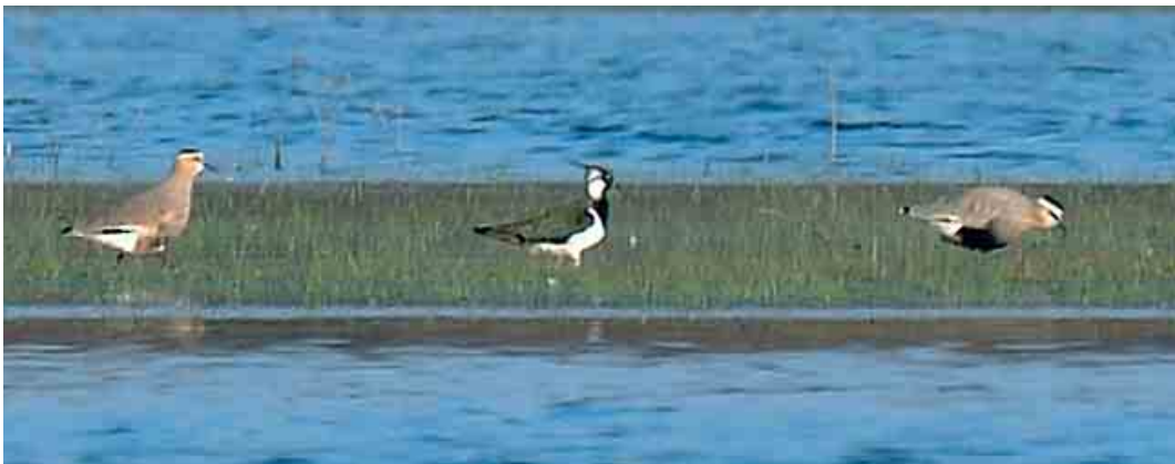
251 Laughing Gull / Lachmeeuw Larus atricilla , first-winter, and Great Black-backed Gull / Grote Mantelmeeuw L. marinus , first-winter, with Lesser Black-backed Gulls / Kleine Mantelmeeuwen L. fuscus , Tarfaya harbour, Morocco, 10 March 2006 252 Sociable Lapwings / Steppiekieviten Vanellus gregarius , adult (right) and first-year, with Northern Lapwing / Kievit V. vanellus , Moosanger-Bernhardsthal, Niederösterreich, Austria, 8 April 2006

WARBLERS TO FLYCATCHERS In Tafilalt, Morocco, a singing Saharan Olivaceous Warbler Acrocephalus pallidus reiseri was sound-recorded in the palm orchards south of Rissani on 4 April. On the same day, one was seen at nearby Dercaoua, Merzouga. At Ghassate Demnat, c 6 km east of Ouarzazate, at least four were singing in the second week of April. On 13 April, three were singing at Hassi Labied, Merzouga. The status of this species in Morocco is poorly documented (cf Dutch Birding 27: 302-307, 2005) but these sightings suggest that it occurs irregularly or may have been overlooked in the past. In March, a Large-billed Reed Warbler A. orinus was trapped in Thailand and the identification was confirmed by feather samples; this species was known from only one specimen collected in Himachal Pradesh, India, in 1867 (Ibis 144: 259-267, 2002). The first Subalpine Warbler Sylvia cantillans for Lithuania was a first-summer male trapped at Ventes Ragas on 7 May. An Eastern Subalpine Warbler S. c. albistriata was identified in Shetland on 8 May. If accepted, a Ménétries's Warbler S. mystacea trapped in the Camargue on 22 April will be the first for France. In the Netherlands, a male Sardinian Warbler S. melanocephala was photographed at Hargen, Noord-Holland, on 26-27 April; a female was reported on Schier-