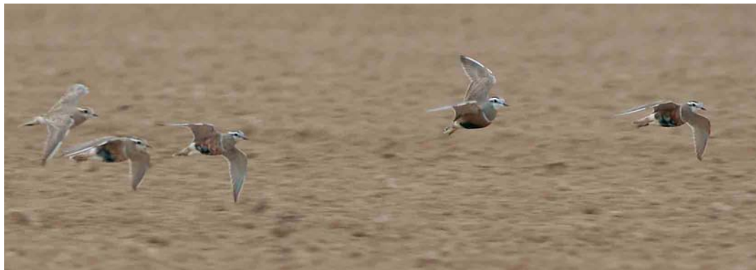
273 Morinelplevieren / Eurasian Dotterels Charadrius morinellus , Outgaarden, Vlaams-Brabant, 23 April 2006

ZWALUWEN TOT GORZEN Op 29 april foerageerde kortstondig een Roodstuitzwaluw Cecropis daurica boven Het Vinne in Zoutleeuw, Vlaams-Brabant. Grote Piepers Anthus richardi werden waargenomen in Ninove, Oost-Vlaanderen, op 9 april