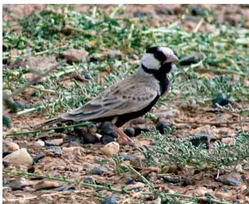
238 Blue Rock Thrush / Blauwe Rotlijster Monticola solitarius , male, Szársomlyó, Hungary, 23 April 2006 239 Asian Short-toed Lark / Mongoolse Kortteenleeuwerik Calandrella cheleensis niethammeri , Ereğli marshes, Konya, Turkey, 2 May 2006 240 Calandra Lark / Kalanderleeuwerik Melanocorypha calandra , Isle of Fife, Scotland, 13 May 2006 241 Black-crowned Sparrow-lark / Zwartkruinvinkleuwerik Eremopterix nigriceps albifrons , male, between Dakhla and Awserd, Western Sahara, Morocco, 12 March 2006

April. A Masked Wagtail M personata was photographed on Öland, Sweden, on 29 April. In Egypt, at least three African Pied Wagtails M aguimp were seen at Abu Simbel on 10-11 April. Seven Bohemian Waxwings Bombycilla garrulus were reported from Samsun, Asarcük, Turkey, on 2-7 April. If accepted, a Black-throated Accentor Prunella atrogularis at Kaipola, Jämsä on 17 April will be the seventh for Finland. An Alpine Accentor P collaris at Munkeuphøve, Nordsjælland, on 18 April was the 11th for Denmark. Another turned up on Helgoland on 3 May.