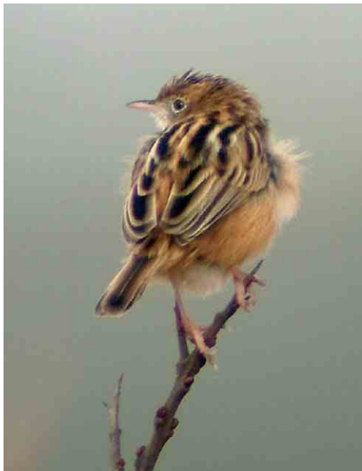
265 Graszanger / Zitting Cisticola Cisticola juncidis , Lentevreugd, Katwijk, Zuid-Holland, 22 maart 2006 (Menno van Duijn) 266 Graszanger / Zitting Cisticola Cisticola juncidis , Lentevreugd, Katwijk, Zuid-Holland, 16 maart 2006 (Luuk Punt) 267 Kleine Zwartkop / Sardinian Warbler Sylvia melanocephala , mannetje, Hargen aan Zee, Noord-Holland, 27 april 2006 (Christiaan Giljam)