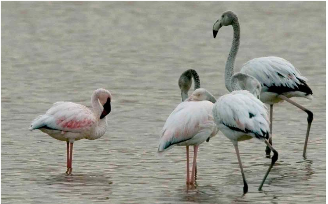
231 Lesser Flamingo / Kleine Flamingo Phoenicopterus minor (left), with Greater Flamingos / Flamingo's P roseus , Eilat, Israel, April 2006