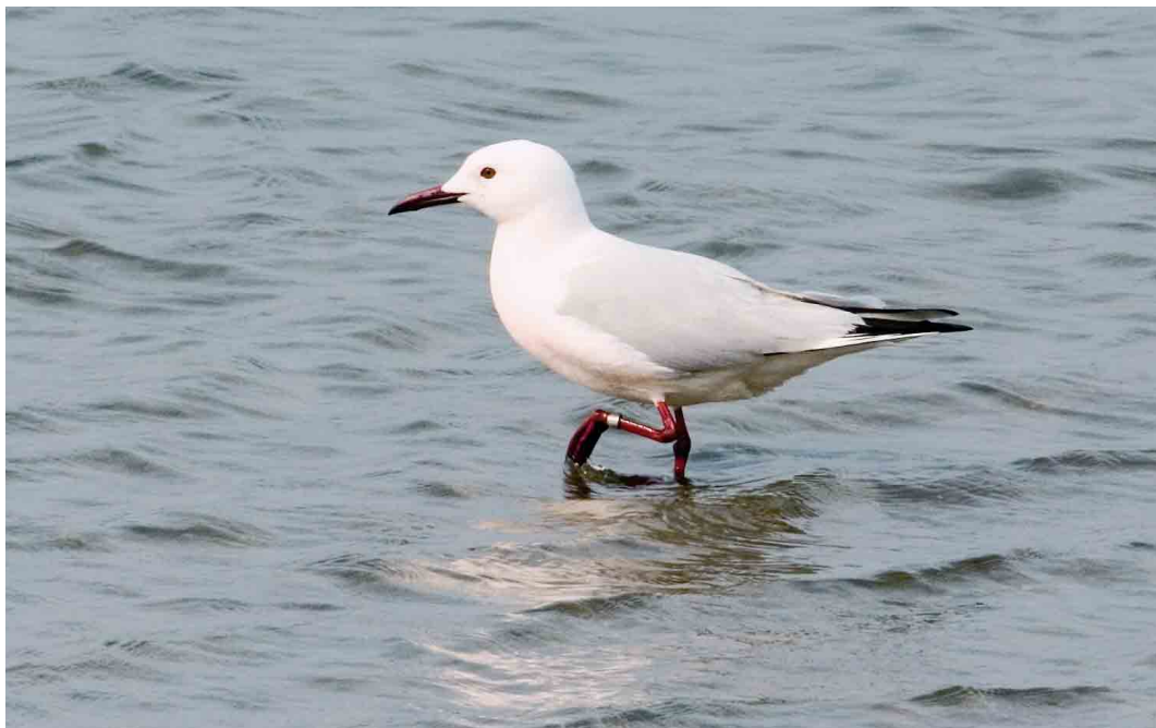
281 Dunbekmeeuw / Slender-billed Gull Larus genei , Het Zwin, West-Vlaanderen, 9 mei 2006 (Patrick Beirens)