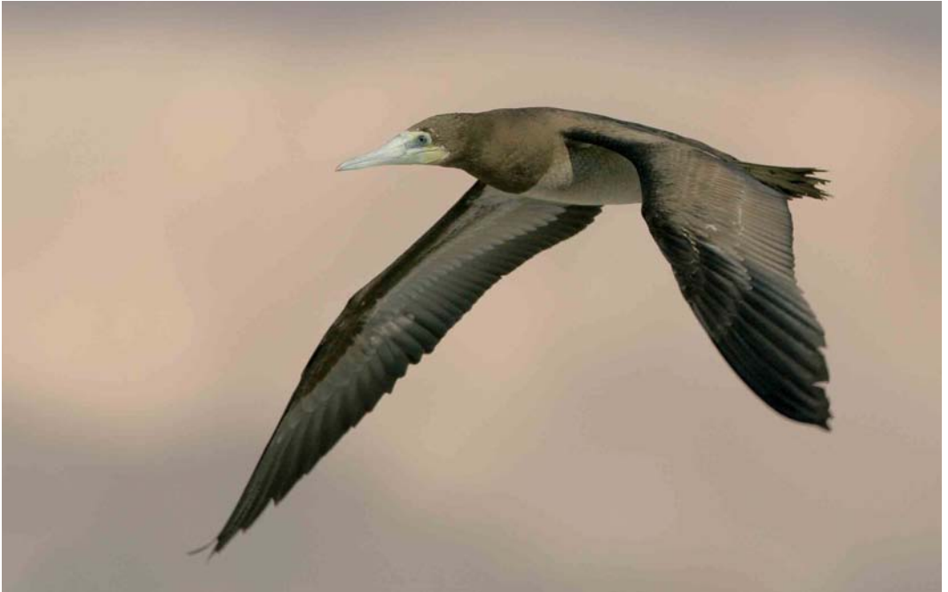
230 Brown Booby / Bruine Gent Sula leucogaster , Eilat, Israel, 2 April 2006 (Arie Ouwerkerk)