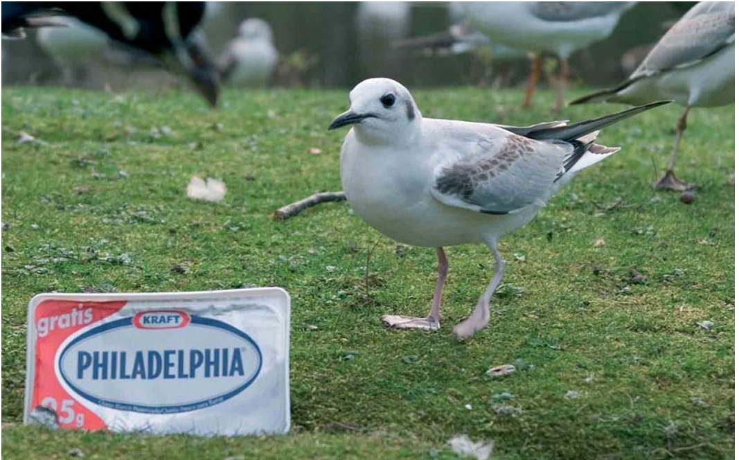
243 Bonaparte's Gull / Kleine Kokmeeuw Larus philadelphia , Parque Isabel La Catolica, Xixón, Asturias, 6 March 2006