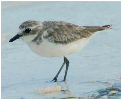
227 Lesser Sand Plover / Mongoolse Plevier Charadrius mongolus , second calendar-year, Lhaviyani Atoll, Maldives, July 2004. Note structure, with more 'weight' before the legs than in Greater Sand Plover C leschenaultii .