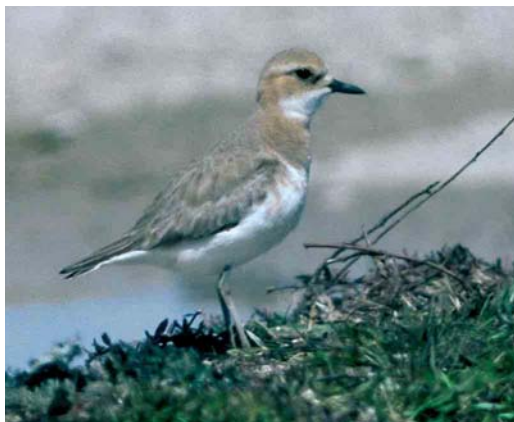
228 Anatolian Sand Plover / Anatolische Woestijnplevier Charadrius leschenaultii columbinus , female, Silifke, Turkey, 21 March 1987 (Arnoud B van den Berg). Note short but pointed bill, lacking bulbous tip of Lesser Sand Plover C mongolus .

approaches Lesser Sand most in this respect, especially the western subspecies of Lesser Sand (Tibetan Sand Plover, ie, the ' atrifrons subspecies group', comprising C m pamirensis , atrifrons and schaeferi ), but never shows a bill-tip as blunt as Lesser Sand. When measured, the nail of the mystery bird covers only c 45% of the total bill length, thereby favouring Lesser Sand. The shape of the nail is rather bulbous and, therefore, fits Lesser Sand better. Even more structural features can be measured from photographs and used for identification. In columbinus , the tarsus length is at most 1.78 times the bill length, while the minimum value for Lesser Sand ( C m schaeferi ) is 1.70. The mystery bird shows a tarsus about two times longer than the bill length, well into the range of Lesser Sand and well beyond the maximum reported for Greater Sand.