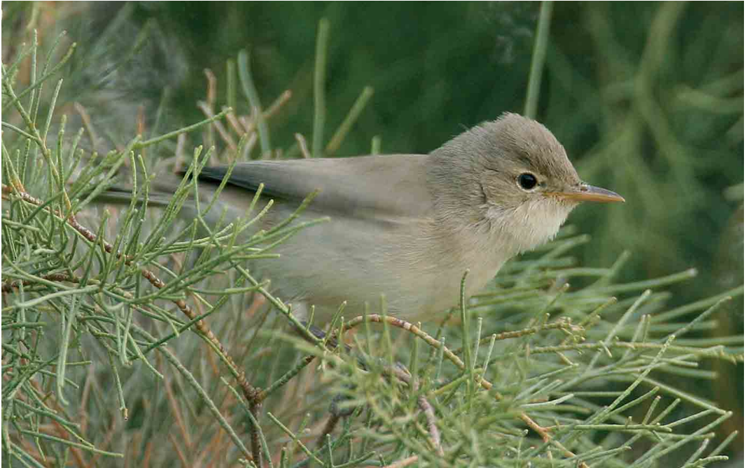
247 Saharan Olivaceous Warbler / Saharaanse Vale Spotvogel Acrocephalus pallidus reiseri , Hassi Labied, Merzouga, Morocco, 13 April 2006