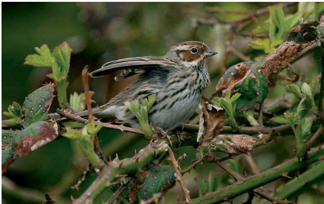
269 Dwerggors / Little Bunting Emberiza pusilla , Katwijk, Zuid-Holland, 12 april 2006