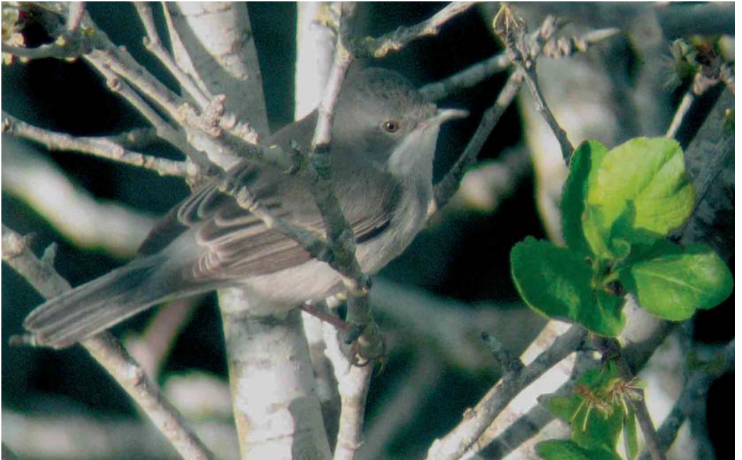
248 Rüppell's Warbler / Rüppells Grasmus Sylvia rueppellii , female, Dwejra, Malta, 26 March 2006