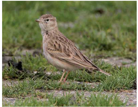
570 Raddes Boszanger / Radde's Warbler Phylloscopus schwarzi , Kennemerduinen, Bloemendaal, Noord-Holland, 13 oktober 2006 (Erik Maassen/Vrs van Lennep) 571 Veldrietzanger / Paddyfield Warbler Acrocephalus agricola , Meijendel, Zuid-Holland, 14 oktober 2006 (Vincent van der Spek/Vrs Meijendel) 572 Siberische Boompieper / Olive-backed Pipit Anthus hodgsoni , Oosterreeweg, Schiermonnikoog, Friesland, 15 oktober 2006 (Martijn Bot) 573 Kortteenleeuwerik / Greater Short-toed Lark Calandrella brachydactyla , Oosterend, Terschelling, Friesland, 25 oktober 2006 (Arie Ouwerkerk)

RALLEN TOT ALKEN Op 8 september werd een eerstejaars Klein Waterhoen Porzana parva gevangen en geringd in het Verdrongen Land van Saeftinghe, Zeeland. Kraanvogels Grus grus trokken door vanaf 12 oktober en vooral op 16 oktober werden grote groepen waargenomen, zoals ten minste 113 over Epen, Limburg, en meer dan 1000 over Maastricht, Limburg. Een Steltkluit Himantopus himantopus werd op 7 oktober gemeld op het Landje van Naber bij Hoorn, Noord-Holland. De Steppevorkstaartplevier Glareola nordmanni van de omgeving van Ransdorp werd weer gezien van 13 tot 18 september. Van 14 tot 20 oktober verbleef een exemplaar bij Eemnes, Utrecht. Ongedetermineerde vorkstaartplevieren vlogen op 17 oktober over natuurontwikkelingsgebied Willeskop, Utrecht, en bij telpost Brobbelbies bij Uden, Noord-Brabant. Er werden tot 13 oktober nog c 70 Morinelplevieren Charadrius morinellus gemeld. Vermeldenswaard zijn twee exemplaren aan