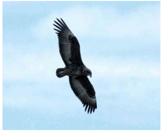
514-515 Bateleur / Bateleur Terathopius ecaudatus , juvenile, Kalahari Gemsbok National Park, North Cape, South Africa, 12 March 1996

The mystery bird also does not fit one of the Haliaeetus species, of which Bald Eagle H leucocephalus was mentioned most. Again, the bill of the mystery bird is much too small to fit one of the fish eagles. Furthermore, all fish eagles show a rather strongly patterned upperwing in juvenile plumage with pale or brownish tips to the greater and median coverts, a pale mantle and in most cases a whitish uppertail, creating a strong variegated pattern, quite unlike the rather uniform upperwing of the mystery bird.