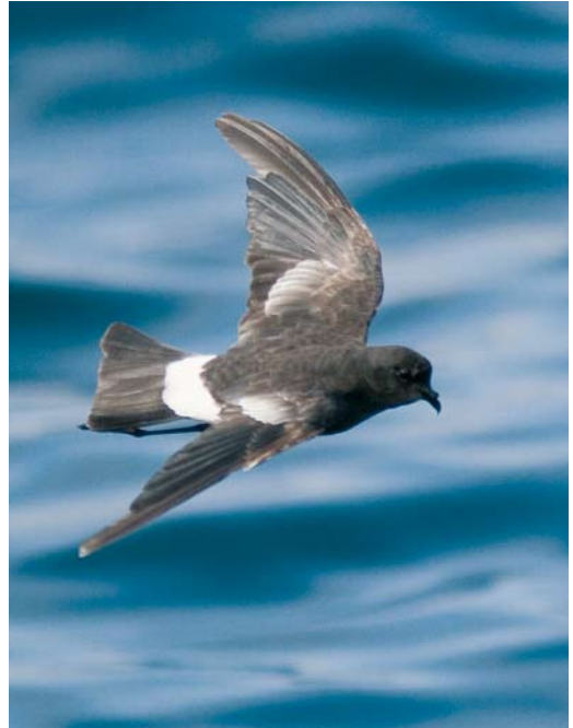
441 Atlantic Yellow-nosed Albatross / Atlantische Geelneusalbatros Thalassarche chlorohychnos, immature, with Greylag Goose / Grauwe Gans Anser anser, Messingham, Lincolnshire, England, 3 July 2007 cf Dutch Birding 29: 242, 2007 442-443 Wilson's Storm-petrel / Wilsons Stormvogeltje Oceanites oceanicus, c 39 km south off Vestmannaeyjar, Iceland, 11 August 2007