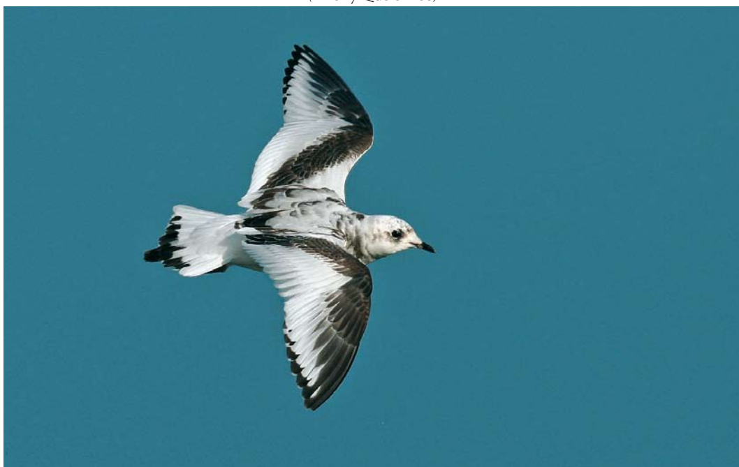
49 Ross's Gull / Ross' Meeuw Rhodostethia rosea , first-year, Douarnenez, Finistère, France, 1 January 2008 ( Thierry Queennec )