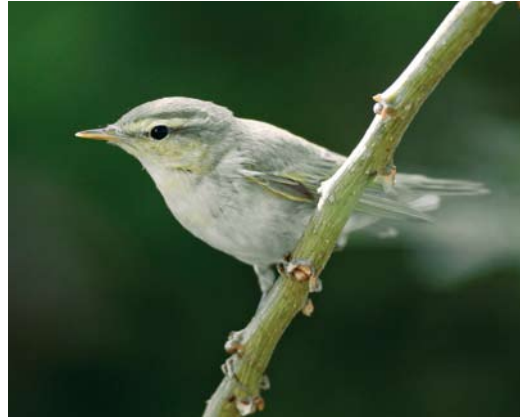
138 Mystery photograph IV (October)

30: 34, 2008) carefully and identify the birds in the photographs. Solutions can be sent in three different ways: