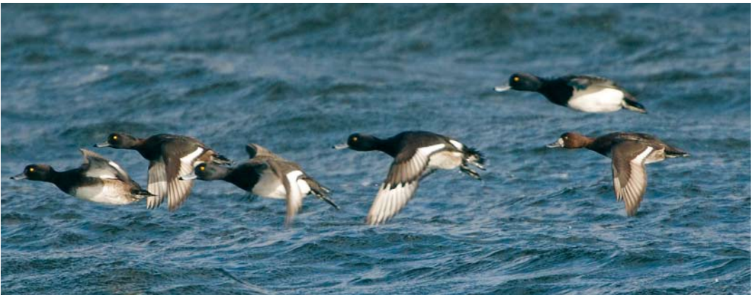
144 Killdeer / Killdeerplevier Charadrius vociferus , Cecebre reservoir, A Coruña, Spain, 21 January 2008 145 Spotted Sandpiper / Amerikaanse Oeverloper Actitis macularius , Lisvane Reservoir, Wales, 10 February 2008 146 Barrow's Goldeneye / IJslandse Brilduiker Bucephala islandica , male, Quoile Pondage, Down, Northern Ireland, 15 March 2008 147 American Scoter / Amerikaanse Zee-eend Melanitta americana , male (right), with Black Scoters / Zwarte Zee-eenden M nigra , St Peter Ording, Schleswig-Holstein, Germany, February 2008 148 Lesser Scaup / Kleine Topper Aythya affinis , female (right), with Tufted Ducks / Kuifeenden A fuligula , Cullivoe Yell, Shetland, Scotland, 6 February 2008