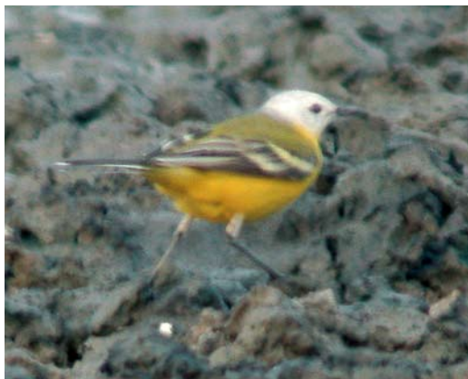
115 White-headed Wagtail / Witkopkwikstaart Motacilla leucocephala , male, Kolshengel, Taukum desert, Almaty province, Kazakhstan, 10 May 2007