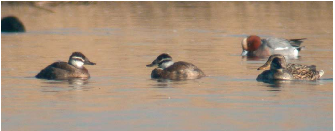
468 Surf Scoter / Brilzee-eend Melanitta perspicillata , adult male, with Common Eider / Eider Somateria mollissima , female, Horsmeertjes, Texel, Noord-Holland, 9 May 2010 469 White-headed Ducks / Witkopeenden Oxyura leucocephala , Starrevaart, Leidschendam, Zuid-Holland, 28 February 2010

bird, already accepted for the winter of 2007/08 (Ovaa et al 2009). The returning bird at Wieringermeer was first accepted for 26 December 2003 to 2 March 2004 (van der Vliet et al 2006).