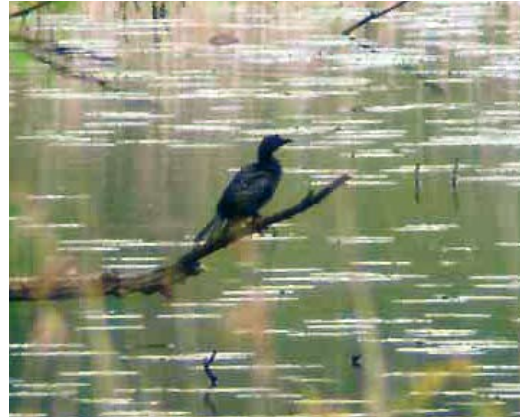
470 Pygmy Cormorant / Dwergaalscholver Phalacrocorax pygmeus , Ooijse Graaf, Ooijpolder, Gelderland, Netherlands, 12 May 2010

This is a date extension of a bird previously accepted for 25-30 April 1995 (van den Berg & Bosman 2001). This species is no longer considered since 1 January 2000 but the CDNA still welcomes reports from before this date.