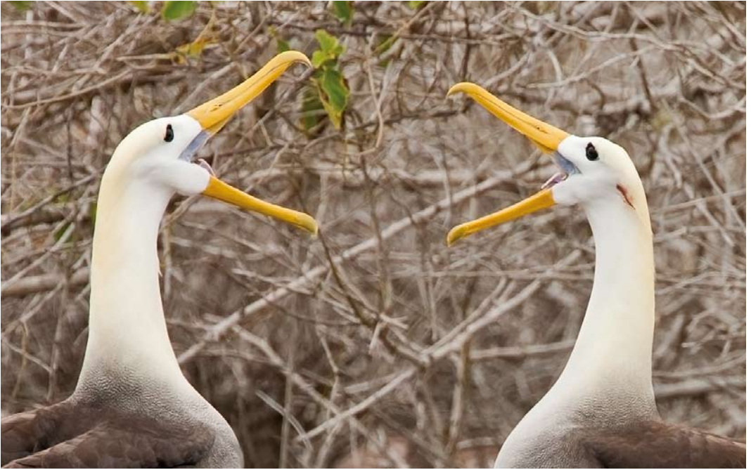
511-512 Waved Albatrosses / Galápagosalbatrossen Phoebastria irrorata , Galápagos Islands, 7 June 2006