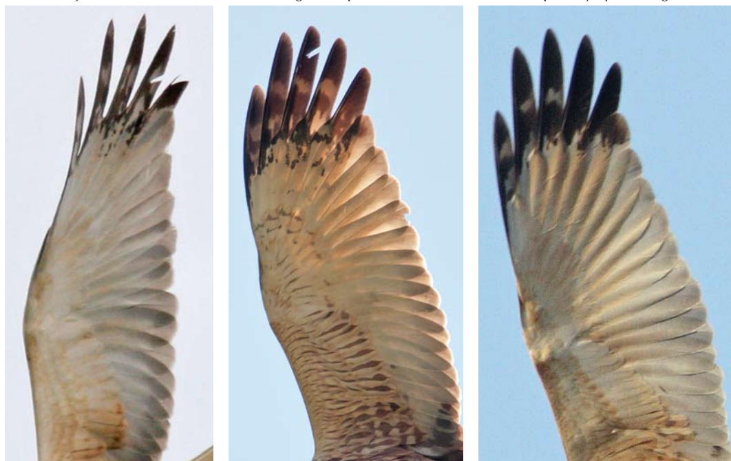
FIGURE 2 Primary tips of three adult males Western Marsh Harrier / Bruine Kiekendief Circus aeruginosus . From left to right: Hasselt, Overijssel, 2006 (same image as in plate 498); Hasselt 2009 (same image as in plate 499); and Nijkerk, Gelderland, 2009 (same image as in plate 501). Note differences in primary tip markings.

As DF already guessed and supported by the development in the Nijkerk bird, the uncommon markings are probably age-related changes in the remiges. As males Western Marsh Harrier get