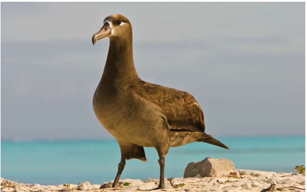
509 Black-footed Albatross / Zwartvoetalbatros Phoebastria nigripes , Midway Atoll, Hawaii, 9 April 2010