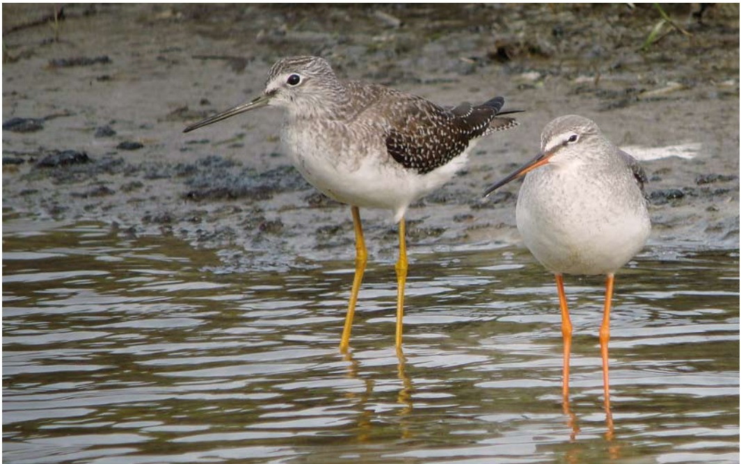
474 Greater Yellowlegs / Grote Geelpootruiter Tringa melanoleuca , first-year, with Spotted Redshank / Zwarte Ruiter T erythropus , Colijnsplaat, Zeeland, 18 October 2010

The bird was photographed by a single observer in late morning on concrete blocks of a pier 1 km off the North Sea beach. The photographs were sent a few hours later by e-mail to CDNA member Roy Slaterus, who identified the bird almost immediately. Despite extensive searching by many people during the same and the following day, it could not be found again. This was only