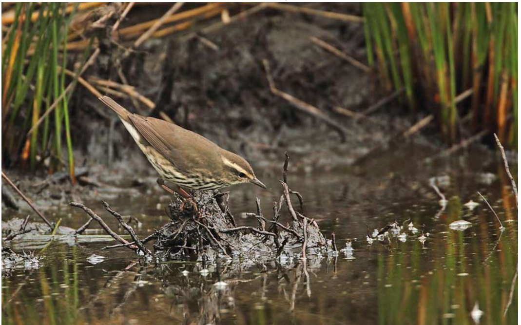
536 Northern Waterthrush / Noordse Waterlijster Parkesia noveboracensis , St Mary's, Scilly, England, 10 October 2011