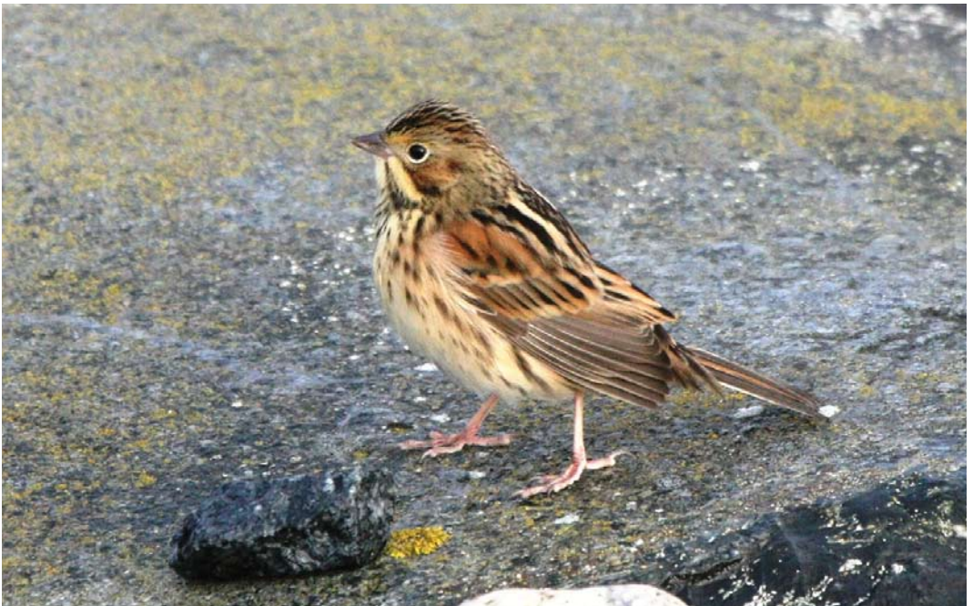
538 Chestnut-eared Bunting / Grijskopgors Emberiza fucata , Understen, Uppland, Sweden, 25 October 2011