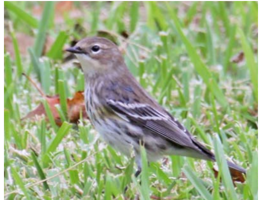
551 Tennessee Warbler / Tennesseezanger Oreothlypis peregrina , Corvo, Azores, 7 October 2011 (Vincent Legrand) 552 Dickcissel / Dickcissel Spiza americana , first-year male, Corvo, Azores, 26 September 2011 (Richard Ek) 553 Blue-winged Warbler / Blauwvleugelzanger Vermivora cyanoptera , Ribeira da Ponte, Corvo, Azores, 2 October 2011 (Vincent Legrand) 554 Yellow-rumped Warbler / Mirtzanger Setophaga coronata , Lagoa Azul, São Miguel, Azores, 30 October 2011 (Ton Eggenhuizen)

from 19 September to 7 October, on São Miguel on 16-24 October and on Santa Maria (two long-stayers); a Western Sandpiper C. mauri on Terceira on 15-19 September; a juvenile Hudsonian Whimbrel on Terceira through September-October; Upland Sandpipers on Flores on 5-24 October and 13 October; a Greater Yellowlegs on Flores on 22 October; and Solitary Sandpipers on Terceira on 19-21 September and on São Miguel on 25-29 September. A Laughing Gull L. atricilla was seen on Corvo on 23 October. On Corvo, single Yellow-billed Cuckoos were found on 20-24 October and 25 October. A Common Nighthawk Chordeiles minor was photographed on Flores on 13 October. A Chimney Swift Chaetura pelagica was present on Corvo on 21-26 October. The first to fifth Philadelphia Vireos V. philadelphia occurred on Corvo from 30 September to 4 October and on 1-8 October and on Flores on 5 October. Six Red-eyed Vireos were found on Corvo between 30 September and 18 October and one was