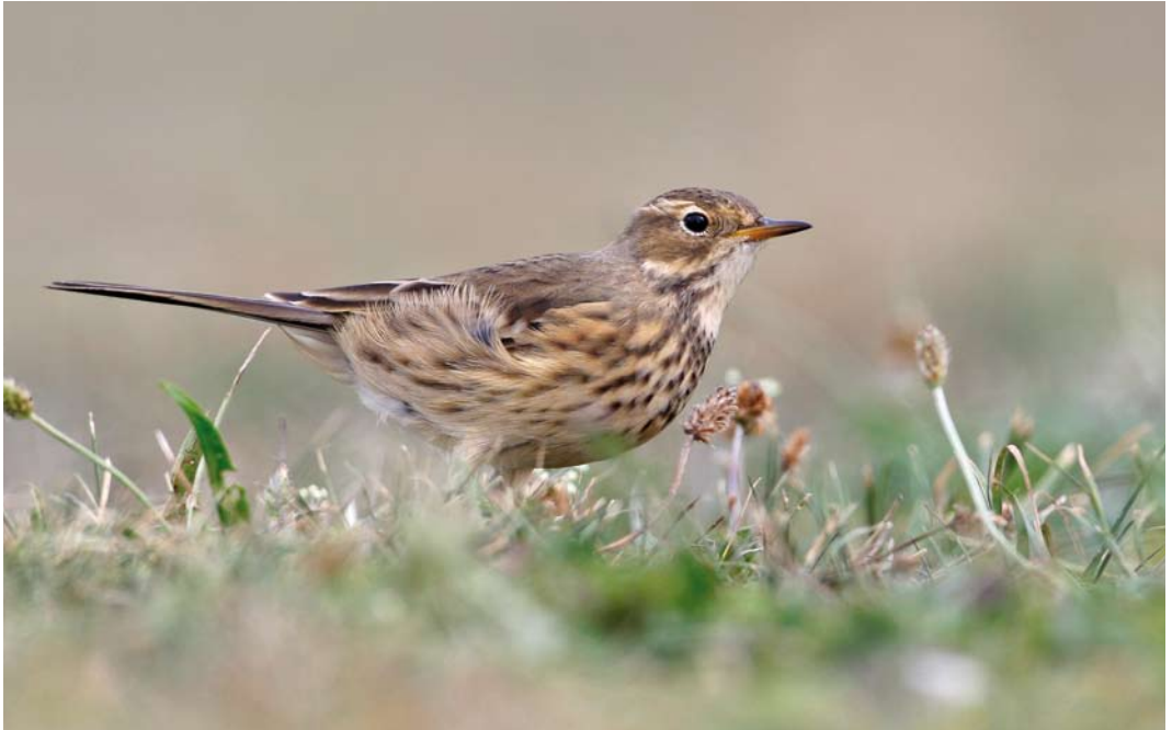
535 Buff-bellied Pipit / Amerikaanse Waterpieper Anthus rubescens rubescens , first-year, A Coruña, Galicia, Spain, 27 September 2011