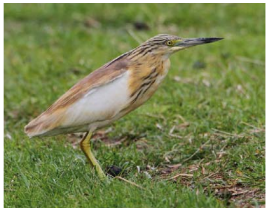
485 Pallid Harrier / Stepekiekendief Circus macrourus , juvenile male, Zwanenwater, Noord-Holland, 27 September 2011 486 Pallid Harrier / Stepekiekendief Circus macrourus , juvenile, Rosmalen, Noord-Brabant, 6 September 2011 487 Gyrfalcon / Giervalk Falco rusticolus , juvenile, Katwijk aan Zee, Zuid-Holland, 14 October 2011 488 Eleonora's Falcon / Eleonora's Valk Falco eleonora , second calendar-year, Oostvaardersplassen, Lelystad, Flevoland, 17 September 2011 489 Ring-necked Duck / Ring-snaveleend Aythya collaris , adult male, Krammersluizen, Philipsdam, Zeeland, 17 April 2011 490 Squacco Heron / Ralreiger Ardeola ralloides , De Driehoek, Texel, Noord-Holland, 29 May 2011