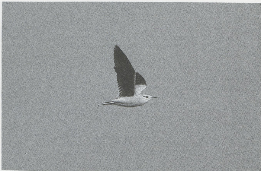
15 Renvogel Cursorius cursor , Camperduin, Noordholland, oktober 1987

De Renvogel werd bij het foerageren regelmatig door Kieviten en Kokmeeuwen achterna gezeten en vloog dan vaak op. Bij het overvliegen van een Kievit en van een Knobbelzwaan Cygnus olor drukte de vogel zich plat tegen de grond. Af en toe woelde hij met de borst en buik wat grond los alvorens te gaan zitten. Dit gedrag werd ook waargenomen toen hij 's avonds bij het donker worden ging slapen.