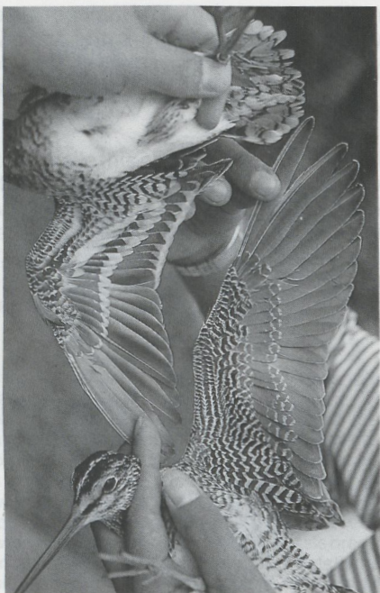
9 Swinhoe's Snipe Gallinago megala , Japan, September 1983 (Kiyooki Ozaki) 10 Common Snipe Gallinago gallinago (top) and Swinhoe's Snipe G. megala (bottom), Japan, September 1983 (Kiyooki Ozaki)

The snipe trapped at Eilat in November 1984 showed all the classic features of Pintail Snipe mentioned above. It was a first-winter bird, judging from the sandy tips to the outer primaries, the presence of juvenile coverts between the moulted adult-type feathers and the remiges that were all of the same age (cf Prater et al. ).