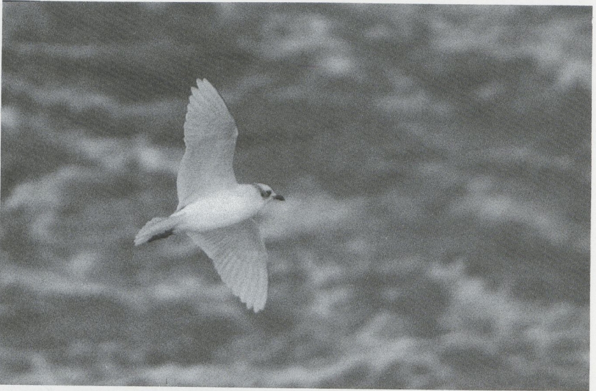
31 Zwartkopmeeuw Larus melanocephalus , Texel, Noordholland, oktober 1987 (Arnoud B van den Berg)

Lachstern Gelochelidon nilotica bij Koksijde Wvl. Kleine Alken Alle alle werden vooral gezien tussen 5 en 11 november en van 21 tot 28 november, met een recordaantal van 63 exemplaren bij Camperduin op 26 november. In deze laatste periode werden ook verschillende Papegaaiduikers Fratercula arctica opgemerkt.