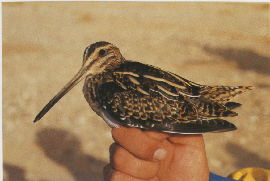
2 Common Snipe Gallinago gallinago , Israel, November 1985 (Hadoram Shirihai) 3 Great Snipe Gallinago media , Israel, September 1985 (Hadoram Shirihai)