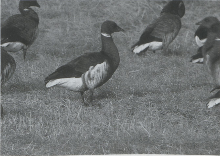
24 Zwarte Rotgans Branta bernicla nigricans , Grevelingendam, Zeeland, december 1987

bleef er een in de Kievitslanden Fl. Flamingo's Phoenicopterus ruber roseus werden gezien tussen het Dijkwater Z en de Grevelingendam Z (twee) en in de Flaauwers Inlagen Z (drie), vergezeld door Chileense Flamingo's P chilensis . De eerste Dwerggans Anser erythropus van het winterseizoen werd op 14 november opgemerkt bij Anjum Fr. Andere exemplaren volgden op 5 december bij Zandvliet A, op 6 en 28 december aan de Strandgaperweg Fl, op 17 december bij Zuid-Beijerland Zh, op 19 en 30 december bij Damme Wvl en op 20 december bij Doel A. Twee Ross' Ganzen A rossii die van 25 tot 27 oktober in de achterhaven bij Zeebrugge verbleven, werden op 19 december herontdekt bij Damme. Witbuikrotganzen Branta bernicla hrota waren present op Wieringen Nh van 18 tot 21 november, in het Veerse Meer Z op 14 en 15 december (drie) en bij Scheveningen Zh op 15 december. Op 9 november werd een Zwarte Rotgans B b nigricans gezien op Ameland Fr, op 15 november zat er een bij Bruinisse Z, van