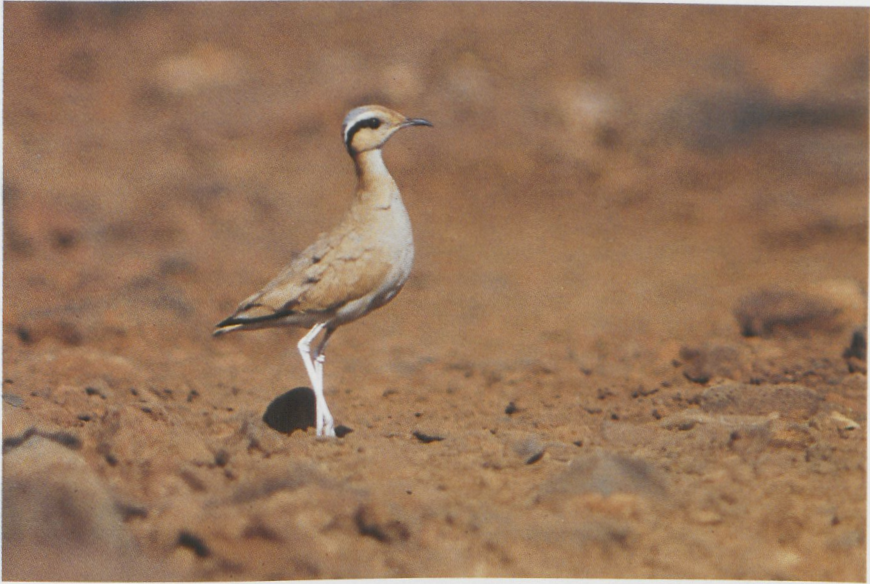
20 Cape Verde Islands Courser Cursorius cursor exsul, Santiago, Cape Verde Islands, February 1986