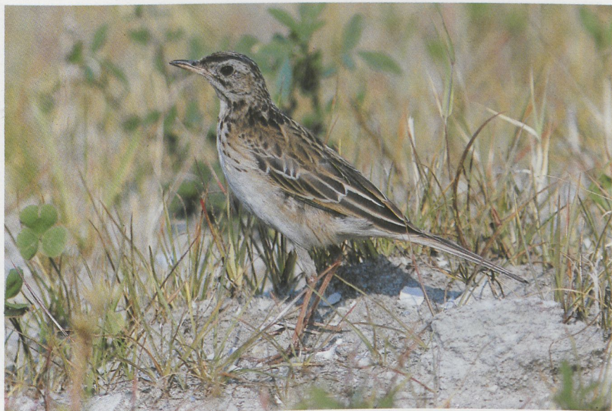
29 Grote Pieper Anthus richardi , Maasvlakte, Zuidholland, oktober 1987 30 Siberische Boompieper Anthus hodgsoni , Texel, Noordholland, oktober 1987