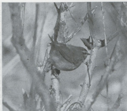
34 Raddes Boszanger Phylloscopus schwarzi , Blankenberge, Westvlanderen, november 1987 (Luc Verroken)

Zeebrugge en op 7 november langs de Oostvaardersdijk. Vooral in de eerste en de vierde week van oktober kwamen Bladkoninkjes P inornatus in de Lage Landen aan. Er werden c 35 exemplaren gemeld. Op 8 november was er nog een vangst bij Castricum en van 11 tot 14 november verbleef een exemplaar met kenmerken van de ondersoort P i humei bij Blankenberge Wvl. De waarneming van een Raddes Boszanger P schwarzi van 31 oktober tot 2 november, eveneens bij Blankenberge, was het tweede geval voor België. Op 1 november werd de vogel geringd. Ongekend waren het aantal Bruine Boszangers P fuscatus dat werd aangetroffen en het relatieve gemak waarmee deze skulkers zich lieten observeren. Op 13 oktober werd er een gevangen bij Kampen O. Van 17 tot 19 oktober en op 24 oktober zat er een op Texel, op 18 oktober een bij Zeebrugge, van 31 oktober tot 2 november zeker twee op de Maasvlakte Zh, op 31 oktober was er een vangst te Stabroek A, op 7 november werd er een gezien bij Egmond-Binnen Nh, van 6 tot 10 november een bij Zeebrugge (geringd op 9 november) en op 10 en 11 november een bij