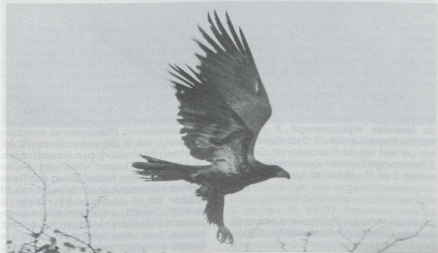
21-22 Bald Eagle Haliaeetus leucocephalus , Ireland, November 1987

Britain's first Philadelphia Vireo Vireo philadelphicus . The only WP record so far was in Ireland in October 1985. A Pallas's Rosefinch Carpodacus roseus trapped at Blavand, Jutland, on 13 October was a totally unexpected addition to the Danish list. Fair Isle, Shetland, enjoyed the presence of Britain's second Savannah Sparrow Ammodramus sandwichensis from 30 September to 1 October. As few continental records of American landbirds have been