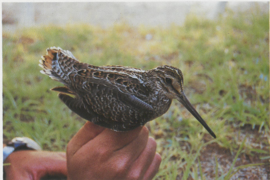
4 Pintail Snipe Gallinago stenura , Israel, November 1984 ( Hadoram Shirihai ) 5 Swinhoe's Snipe Gallinago megala , Japan, September 1983 ( Kiyooki Ozaki )