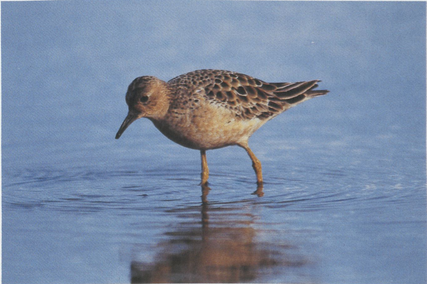
19 Blonde Ruiters Tryngites subruficollis , Lisse, Zuidholland, augustus 1986 (Arie de Knijff)

Hoewel Blonde Ruiters doorgaans kleiner zijn dan Kemphenen (ongeveer zo groot als een Drieteenstrandloper Calidris alba ), kunnen de kleinste Kemphenen toch net zo klein zijn als de grootste Blonde Ruiters. Belangrijkere kenmerken dan het formaat waren dan ook het okerkleurige gezicht met lichte partij rond het oog, de okerkleurige onderdelen met fijne donkere vlekjes op de zij-