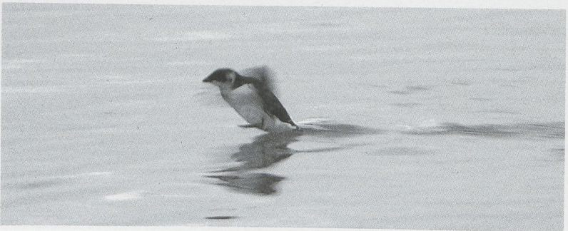
32 Kleine Alk Alle alle , IJmuiden, Noordholland, november 1987 (Arnoud B van den Berg)

GIERZWALUWEN TOT TROEPIALEN Nadat op 20 oktober boven het Westduinpark Zh en op 23 oktober bij Utrecht U al een Alpengierzwaluw Apus melba werd gezien verscheen het eerste voor velen tikbare exemplaar op 28 en 29 oktober bij Wormerveer. Tussen 6 november en 10 december wist een Hop Upupa epops zich in leven te houden in de omge-