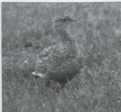
25 Kleine Trap Tetrax tetrax , Urk, Flevoland, december 1987 (Erwin Booij)

zien op 4 oktober bij het Jaap Deensgat, op 17 oktober bij Leuven B en op 26 oktober in de AW-duinen. Doortrekkende Slechtvalken F peregrinus werden voornamelijk begin oktober gezien. Voorts werden minstens 15 pleisterende exemplaren gemeld.