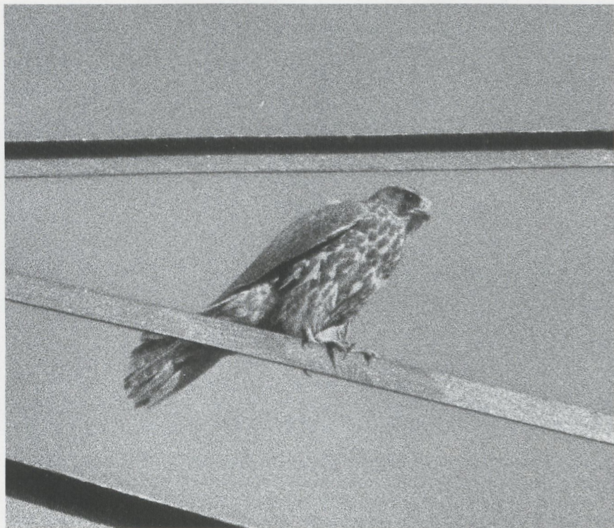
11 Giervalk Falco rusticolus , Eemshaven, Groningen, februari 1987

soms op Fazanten Phasianus colchicus . Eenmaal joeg hij een Torenvalk na. Viermaal kon een geslagen prooi worden gedetermineerd; het betrof een Wilde Eend, een Fazant, een Patrijs Perdix perdix en een Graspieper Anthus pratensis .