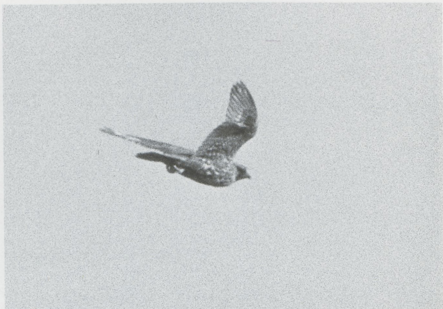
12 Giervalk Falco rusticolus , Eemshaven, Groningen, februari 1987 (Hans Gebuis)

lichte zomen. Onderdelen crèmewit met zware grauwbruine lengtestrepen, op bovenborst losjes beginnend, naar onderen toe snel dichter wordend. Flank en buik zwaar gestreept; veren van zwaarst gestreepte gedeelte vrijwel geheel donker met smal roomwit randje. Anaalstreek roomwit met vage streepjes.