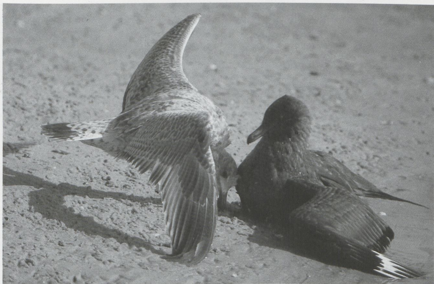
26 Grote Jager Stercorarius skua en Zilvermeeuw Larus argentatus , Texel, Noordholland, oktober 1987

perduin Nh rondstapte bracht twitchend Nederland kortstondig in vervoering. Na aanvankelijk als een Bonapartes Strandloper C fuscicollis te zijn geboekt, moest toch het vlakgom weer te voorschijn gehaald worden toen bleek dat het om een Krombekstrandloper C ferruginea met een afgebroken snavel ging. Op 25 oktober was er een claim van een Poelsnip Gallinago media bij Deventer O. Van 5 tot 11 oktober zat een Grauwe Franjepoot Phalaropus lobatus bij Zeebrugge. Rosse Franjepoten P fulicarius verschenen op 23 oktober op Texel, op 15 november bij Scheveningen en op 28 november bij IJmuiden. In oktober werd op Texel een Grote Jager Stercorarius skua gefotografeerd die een Zilvermeeuw Larus argentatus molesteerde. Zowel op 16 als 22 oktober werden er nog Kleinste Jagers Stercorarius longicaudus gezien bij Westkapelle. Zwartkopmeeuwen Larus melanocephalus waren er bij IJmuiden van 4 oktober tot eind december (maximaal drie), bij Katwijk Zh op 6 en 10 oktober, bij Lier van 12 tot 14 oktober, bij Westkapelle tussen 17 oktober