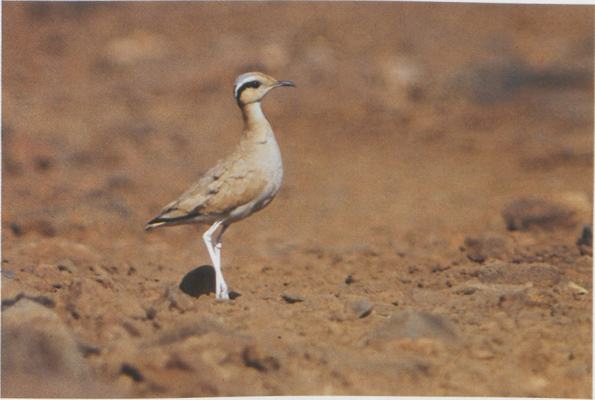
20 Cape Verde Islands Courser Cursorius cursor exsul, Santiago, Cape Verde Islands, February 1986