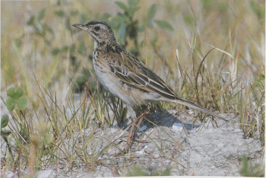
29 Grote Pieper Anthus richardi , Maasvlakte, Zuidholland, oktober 1987 30 Siberische Boompieper Anthus hodgsoni , Texel, Noordholland, oktober 1987