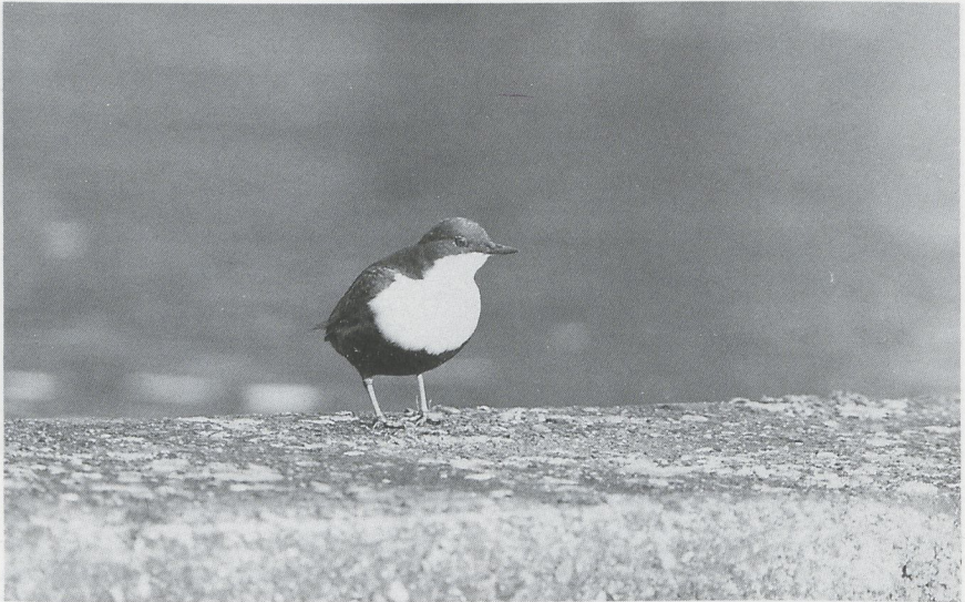
74 Waterspreeuw Cinclus cinclus , AW-duinen, Noordholland, maart 1988

zen B bernicla hrota te Ouddorp en op 10 en 21 maart werd er een waargenomen bij Yerseke. Zwarte Rotganzen B b nigricans werden gezien op 16 januari, tussen c 300 Toendrarietganzen A fabalis rossicus , bij Urk Fl, op 17 en 18 januari bij Westkapelle Z, op 20 januari bij de Grevelingendam Z en op 30 januari één en van 1 tot 4 februari twee op Schiermonnikoog Fr. Roodhalsganzen B ruficollis werden gezien op 2 januari in de Lauwersmeer Gr, van 2 tot 14 januari één en op 7 februari drie bij Strijen, op 17 januari bij Klemskerke en langs de Oostvaardersdijk, op 19 januari bij de Grevelingendam, op 23 januari één en op 6 februari twee in de Bandpolder, van 30 januari tot 7 februari bij Scharendijke Z, op 9 februari drie langs de IJssel bij Wilp Gld, van 13 februari tot 5 maart bij Goedereede, op 24 februari twee in de Workumerwaard Fr, op 2 en 4 maart twee tussen Gaast Fr en Piaam Fr en als laatste op 27 maart op Ameland Fr. De Witoogeend Aythya nyroca van Meer A werd tot 19 januari gezien. De vogel van Overveen Nh kon tot zeker 14 maart worden bewonderd. Andere Witoogeenden waren er op 17 januari op het Engelermeer Nb en van 27 januari tot 7 fe-