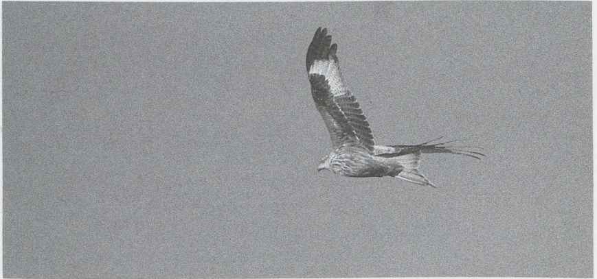
70 Rode Wouw Milvus milvus , Flevoland, december 1987 (Arie de Knijff)

veerde Purperreiger Ardea purpurea werd op 22 februari bij Almere Fl opgemerkt. Vroege Ooievaars Ciconia ciconia waren er op 16 januari bij Grafhorst O (twee) en op 21 februari bij Asperen Zh. Midden maart pleisterden er drie bij Gent Ovl. Verder werd van een klein aantal trekkende exemplaren melding gemaakt in de tweede helft van maart. Op 8 januari zat een Lepelaar Platalea leucorodia op Texel. Tot drie Flamingo's Phoenicopterus ruber roseus werden ook nog in januari en februari bij het Dijkwater Z aan het Grevelingenmeer gezien, wederom in gezelschap van 22 Chileense Flamingo's P chilensis . Vijf Groenlandse Kolganzen Anser albifrons flavirostris werden op 2 januari bij Goedereede Zh gemeld. De Dwerggans A erythropus van Damme Wvl werd ook op 2 en 4 januari gezien. De vogel van Zandvliet A bleef daar tot 24 januari. Op 24 en 25 januari was er één bij Klemskerke Wvl. Maximaal zes Dwergganzen waaronder twee met kleurringen hielden zich van 10 januari tot zeker 8 februari op tussen de ganzen bij Strijen Zh. Op 4 januari was een gekleurindg exemplaar aanwezig in de Bandpolder Fr en van 11 januari tot 18 februari verbleef er één bij Den Bommel Zh. Andere Dwergganzen waren er op 23 januari bij de Kievitslanden Fl en in de Flauwers Inlagen Z, op 6 februari bij Heel L, van 13 januari tot 14 februari één en op 13 februari