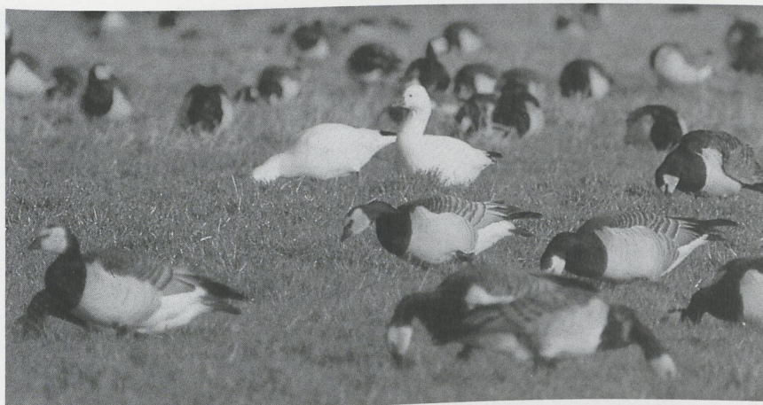
68 Ross' Ganzen Anser rossii , Veerse Meer, Zeeland, februari 1988 (Arnold Meijer)

kaan Pelecanus onocrotalus in Friesland hebben verbleven. Van 5 tot 20 januari en van 27 januari tot 3 februari was een Roze Pelikaan weer bij Elden present. Op 21 januari werd de vogel laag vliegend bij Wageningen Gld gemeld. Op 8 februari werd er één boven Valkenburg L waargenomen en op 9 en 10 februari verbleef een adult exemplaar bij Wittem L. Op 9 februari werd bovendien een noordwaarts vliegend exemplaar bij Druten Gld gemeld zodat er waarschijnlijk twee pelikanen in het spel zijn. Hoogst merkwaardig is de melding van een onvolwassen Kroeskoppelikaan P. crispus die op