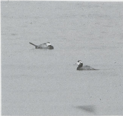
65 Witkopeend Oxyura leucocephala , mannetje in onvolwassen kleed, Turkije, mei 1987 (Arnoud B van den Berg)

Herkennen van onvolwassen mannetje Witkopeend Mannetjes Witkopeenden Oxyura leucocephala hebben in het eerste zomerkleed een geheel zwarte kop of een zwarte kop met een of twee witte vlekken rond het oog (Torres & Ayala 1986). Naarmate ze ouder worden, verschijnt op de oorstreek meer wit. Een deel van de onvolwassen mannetjes heeft een brede zwarte kruin. Ze kunnen hierdoor met een mannetje Rosse Stekelstaart O jamaicensis worden verward.