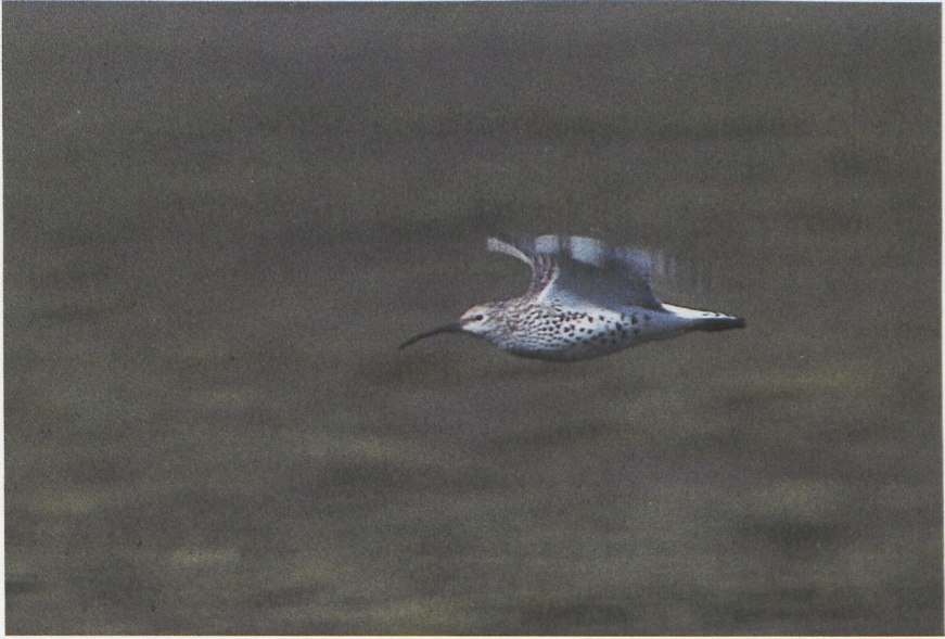
37-38 Slender-billed Curlew Numenius tenuirostris , Morocco, January 1988 (Arnoud B van den Berg)