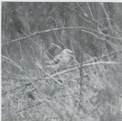
58 Citroenkwikstaart Motacilla citreola , Harchies, Henegouwen, april 1987