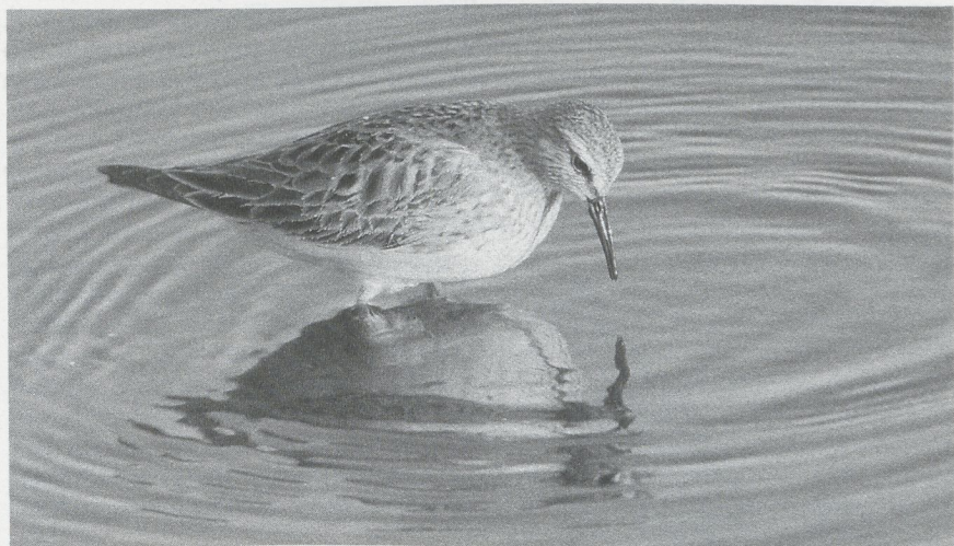
59 White-rumped Sandpiper Calidris fuscicollis , New York, USA, September 1986

27 Mystery photograph 27, showing a Calidris sandpiper, turned out a bit too black and white, thus only allowing a limited view of plumage details. On the other hand, the bird's shape stands out quite clearly and its long wings attract attention: the primary projection approximately equals the projection of the tertials. This points straightforwardly to either White-rumped Sandpiper C fuscicollis or Baird's Sandpiper C bairdii . No other Calidris sandpiper shows this character, except perhaps in active wing moult when tertials can be missing or still growing. The bill seems quite stubby and slightly swollen at the tip which is right for White-rumped but wrong for Baird's which has a rather fine-tipped bill. Now what can be made up from the plumage? Perhaps the choice between White-rumped Sandpiper or Baird's Sandpiper could be settled instantly by flushing the bird so the rump and uppertail-coverts could be seen, but who would lower himself to such a selfish unsporty act? It would be against our code of conduct and unnecessary too because there are more features to be seen. With some patience, our wader will probably reveal its uppertail-coverts anyhow when it is in the right posture. It should be noted that the white of the 'rump' is limited to the uppertail-coverts in White-rumped, unlike the real white rump and uppertail-coverts of Curlew Sandpiper C ferruginea . Baird's has dark-centred rump and uppertail-coverts.