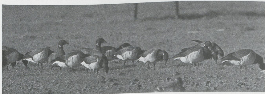
69 Witbuikrotganzen Branta bernicla hrota , Ouddorp, Zuidholland, januari 1988 (Hans Gebuis)

26 maart langs Camperduin vloog. Al op 2 maart werd een adulte Kwak Nycticorax nycticorax bij Wartena Fr gezien. Grote Zilverreigers Egretta alba overwinterden in het Harderbroek Fl en in de polders ten zuiden van Lith Nb. De vogel van Lith werd daar na 4 februari niet meer gemeld. Op 18 februari werd een exemplaar langs de snelweg tussen Zwolle O en Kampen O waargenomen. Op 20 februari verbleven er twee in het Harderbroek en vanaf eind maart waren deze vogels in de Oostvaardersplassen Fl aanwezig. Bij Druten werd op 25 maart ook een Grote Zilverreiger gezien. Een vroeg gearri-