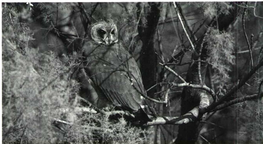
14 Marsh Owl Asio capensis , Moulay Bouselham, Morocco, December 1987 (Arnoud B van den Berg)

Every day in December and January, 9 to 20 Marsh Owls Asio capensis were found roosting together in trees at the shore of Merja Zerga in Moulay Bouselham. When disturbed and flushed, the birds returned to their trees as soon as possible. Interestingly, Cramp (1985) does not mention roosting in trees for this species, which is known as one of the least arboreal of owls.