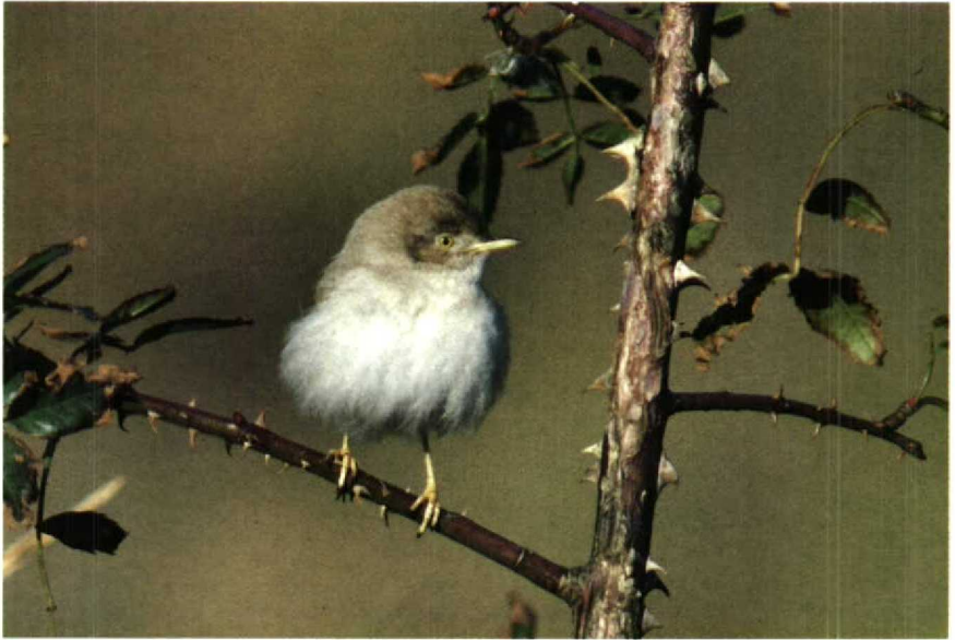
38-39 Woestijngrasmus Sylvia nana , Amsterdamse Waterleidingduinen, Noordholland, november 1988 (Arnoud B van den Berg)