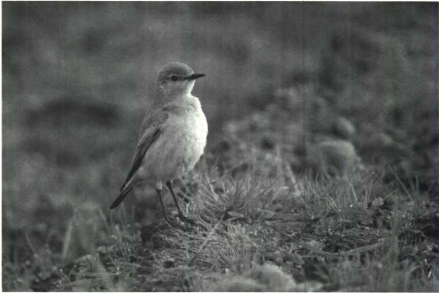
23 Isabelline Wheatear Oenanthe isabellina , Isles of Scilly, Great Britain, October 1988

ford Warbler Sylvia undata for 1988 was at Zeebrugge from 30 October to 1 November. A Desert Warbler S nana near Aerdenhout, Noordholland, from 30 October to 4 November excited 100s of Dutch and Belgian birders and was the first for the Netherlands. Up to five Azure Tits Parus cyanus were present at Kuhmo, Finland, from 27 November to at least 6 December. During September-October at least eight Red-eyed Vireo's Vireo olivacea were recorded in Britain and Ireland, and with two on St. Mary's on 10 October. On 7 October, Fair Isle produced a Blackburnian Warbler Dendroica fusca . This would be the first WP record of this warbler which breeds in eastern North America. A Northern Waterthrush Seiurus noveboracen-