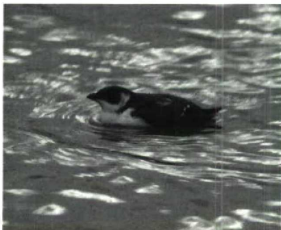
30 Kleine Alk Alle alle , Den Oever, Noordholland, december 1988 (Do van Dijck)

september bij Den Oever Nh begon het pas goed op 8 oktober toen er exemplaren zaten bij Den Helder Nh (twee), IJmuiden (drie), het Kornwerderzand Fr en de Abtskolk bij Petten Nh. Bij IJmuiden waren nog exem-