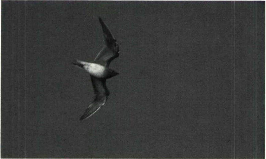
11 Vorkstaartplevier Glareola pratincola , Terneuzen, Zeeland, november 1987

onderdekveren kastanjekleurig. Voorrand ondervleugel bruinzwart.