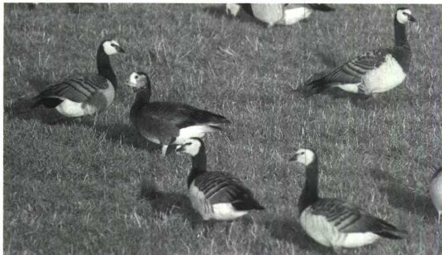
25 Hybride Dwerggans Anser erythropus x Brandgans Branta leucopsis , Den Bommel, Zeeland, december 1988 ( Hans Gebuis )

ken er in het najaar her en der vogels op. Bij het Robbenoordbos Nh, Nuland Nb, in de omgeving van Leiden Zh, op de Strabrechtse Heide Nb en in de Flevo verbleven ze voor langere tijd. Late Zwarte Ooievaars Ciconia nigra waren er op 1 en 8 oktober bij Gent Ovl en op 2 oktober tussen Breukelen U en Abcoude U. Ooievaars Ciconia verschenen in grote groepen: op 1 oktober 25