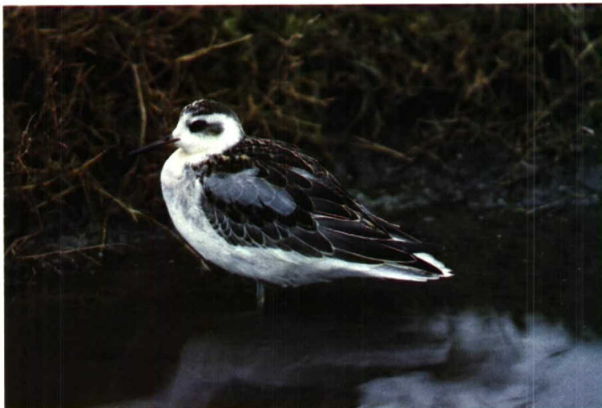
40 Rosse Franjepoot Phalaropus fulicarius , Camperduin, Noordholland, oktober 1988 (Arie de Knijff) 41 Witstuitbarmsijs Carduelis hornemanni exilipes , Westenschouwen, Zeeland, november 1988 (Arnoud B van den Berg, Vrs Nebularia)