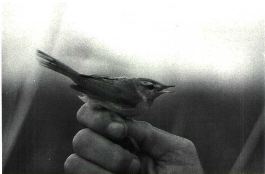
12 Veldrietzanger Acrocephalus agricola , Beninger Slikken, Zuidholland, september 1987 (Wim Oudebeek)

de Jong 1985, de Vries 1987, Terpstra 1988). De twee van 8 september 1987 zijn tevens de vroegste in het najaar. Het samenvallen van beide vangsten op een dag doet veronderstellen dat meerdere Veldrietzangers onopgemerkt zijn gebleven. Debet aan het geringe aantal waarnemingen in Nederland is ongetwijfeld het onopvallende gedrag van de soort in het najaar.