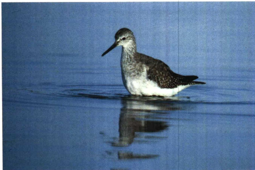
2 Kleine Geelpootruiter Tringa flavipes , Oosterland, Zeeland, november 1979

Poelruiter voorhoofd, voorhals en borst in november vrijwel wit zijn en de poten vrij donker (hoewel soms heldergeel in het voorjaar) en dat de gele kleur aan de snavelbasis ontbreekt. Juveniele Tureluurs hebben soms een geelachtige snavelbasis en poten maar het gekleurde deel van de snavel is veel uitgebreider dan bij de Kleine Geelpoot en omvat eenderde tot de helft van de snavellengte. Bij Bosruiter en Witgatje is de tekening van de bovendelen in elk kleed ongeveer even levendig als die op de dekveren en tertials. De Bosruiter heeft bovendien een duidelijke, ver voorbij het oog doorlopende, scherp afgezette wenkbrauwstreep. De poten van het Witgatje zijn altijd vrij donker groenachtig, die van de Bosruiter soms opvallend geel, gewoonlijk echter groen- of bruinachtig geel. Het winterkleed van de Grote Geelpootruiter heeft veel weg van dat van de Kleine. Bovendelen, borst en flank zijn echter gewoonlijk wat sterker getekend. Eenderde deel van de snavel vanaf de basis is bij de Grote Geelpoot vrij licht groen-, grijs- of geelachtig.