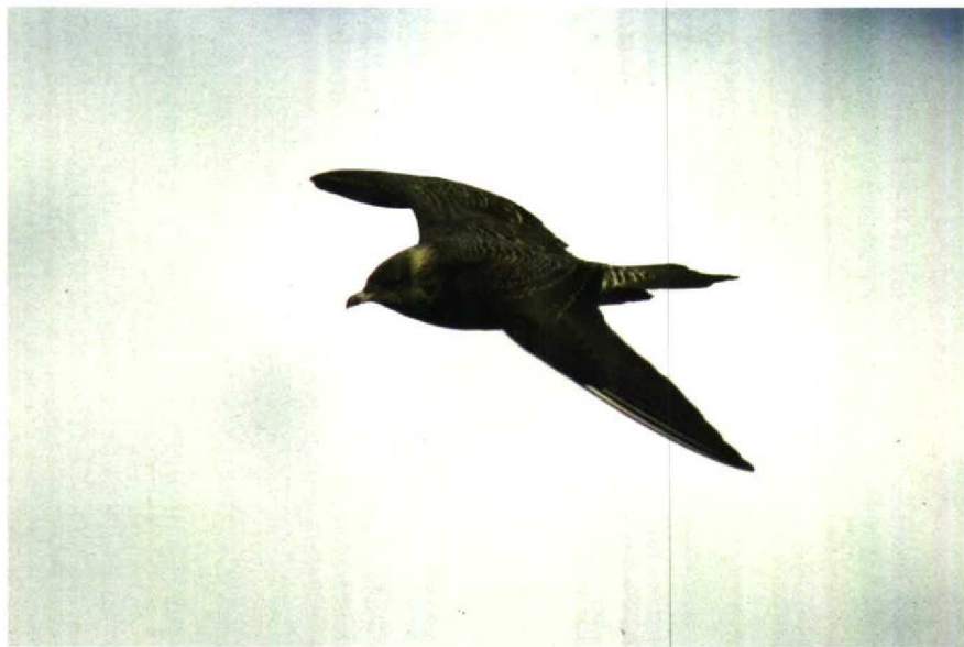
27 Kleinste Jager Stercorarius longicaudus , Westkapelle, Zeeland, oktober 1988 (Jaco Walhout) 28 Kleinste Jager Stercorarius longicaudus , Goedereede, Zuidholland, oktober 1988 (Hans Gebuis)