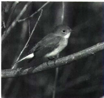
42 Kleine Vliegenvanger Ficedula parva , Maasvlakte, Zuidholland, oktober 1988

Westenschouwen Z, welke op 28 november werden losgelaten, op 26 november weer bij Castricum en bij Anzegem Wvl op 27 november. Claims waren er op 16 november op Schiermonnikoog, op 20 november bij IJmuiden en de Blocq van Kuffeler, op 3 december in het Planken Wambuis Gld en op 10 december op de Dwingeloose Heide D. Vanaf 3 december werden hardnekkig één of meer exemplaren geclaimd op de Pampushaven Fl. Op 30 oktober werd een Grote Kruisbek Loxia pytyopsittacus gevangen bij Tongeren Gld. Claims waren er op 26 november van de Davidsplassen D (twee) en bij Ede (10 à 15) op 14 december. Een mogelijke Bosgors Emberiza rustica vloog op 19 oktober over bij Westkapelle. Verder waren er exemplaren op Schiermonnikoog op 22 oktober en bij Heist op 30 oktober en 1 november. Dwerggorzen E pusilla werden waargenomen op 10 en 14 oktober op Terschelling en op 24 oktober bij Castricum. Een leuke melding betreft een groep van 23 Grauwe Gorzen Miliaria calandra op 10 december op een slaappleats bij Hensies.