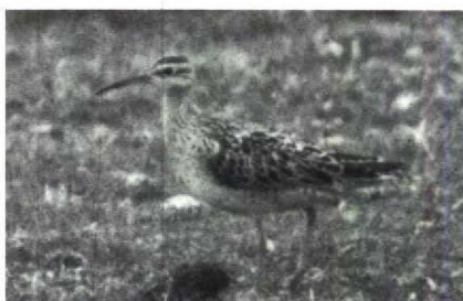
6-7 Little Whimbrel Numenius minutus , Yamdena, Tanimbar Islands, Indonesia, September 1985 (Frank G Rozendaal) 8 Little Whimbrel Numenius minutus , Norfolk, Great Britain, August 1985 (David M Cottridge)

30 Plumage pattern and size and shape of the bill of the bird depicted in mystery photograph 30 only fit the two small curlews, Little Whimbrel Numenius minutus and Eskimo Curlew N borealis , and Upland Sandpiper Bartramia longicauda . The bill seems conclusive for Upland Sandpiper, being straight and rather short. However, the pale pinkish-brown base of the bill fits one of the curlews better than Upland Sandpiper, which has bright yellow or yellowish-brown sides to the bill. Moreover, Upland Sandpiper has the upperparts less coarsely marked than the mystery bird and lacks the pronounced dark eye-stripe, having a prominent large dark eye on a pale yellow-buff face instead. Eskimo Curlew also shows a less pronounced supercilium and eye-stripe than the mystery bird. The markings of the head, neck and upperparts, in combination with the bill colour, only fit Little Whimbrel. The fact that the bill appears to be too short and straight for this species is explained by the tip hav-