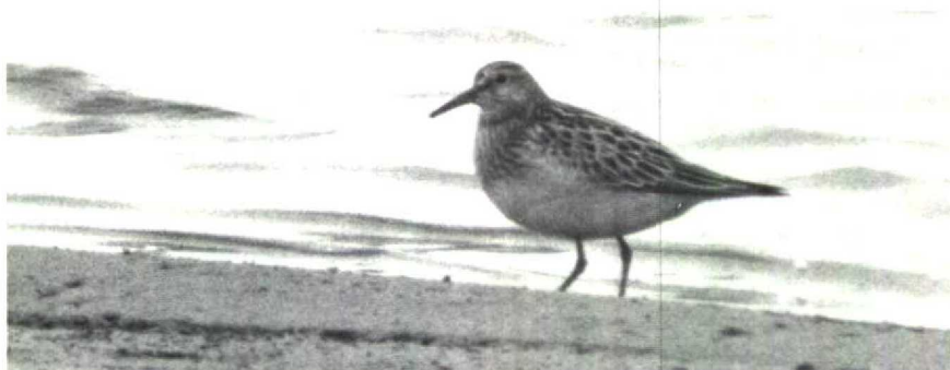
26 Gestreepte Strandloper Calidris melanotos , Philipsdam, oktober 1988 ( Hans Gebuis )

bij Vlijmen Nb, op 3 oktober negen op een lichtmast langs de A2 ter hoogte van Rosmalen Nb, 14 bij Waalwijk Nb en 13 bij 's-Hertogenbosch Nb (ook op 4 oktober) en op 12 oktober negen bij Wijnjewoude Fr. Ten slotte overnachtte er één op 3 december te Middelburg Z en was er vanaf half december één aanwezig bij Kloetinge Z. Twee Flamingo's Phoenicopterus ruber roseus wer-