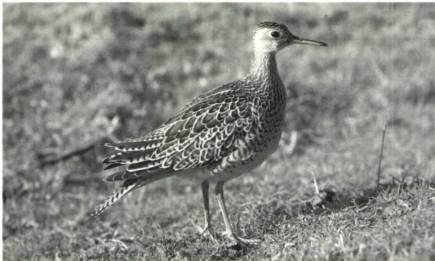
9 Upland Sandpiper Bartramia longicauda , Isles of Scilly, Great Britain, October 1983 (David M Cottridge)

ing broken off, as revealed by additional photographs of the same individual. The bird was photographed by the author on 26 September 1985 at the airstrip of Saumlaki on Yamdena, Tanimbar Islands, Indonesia.