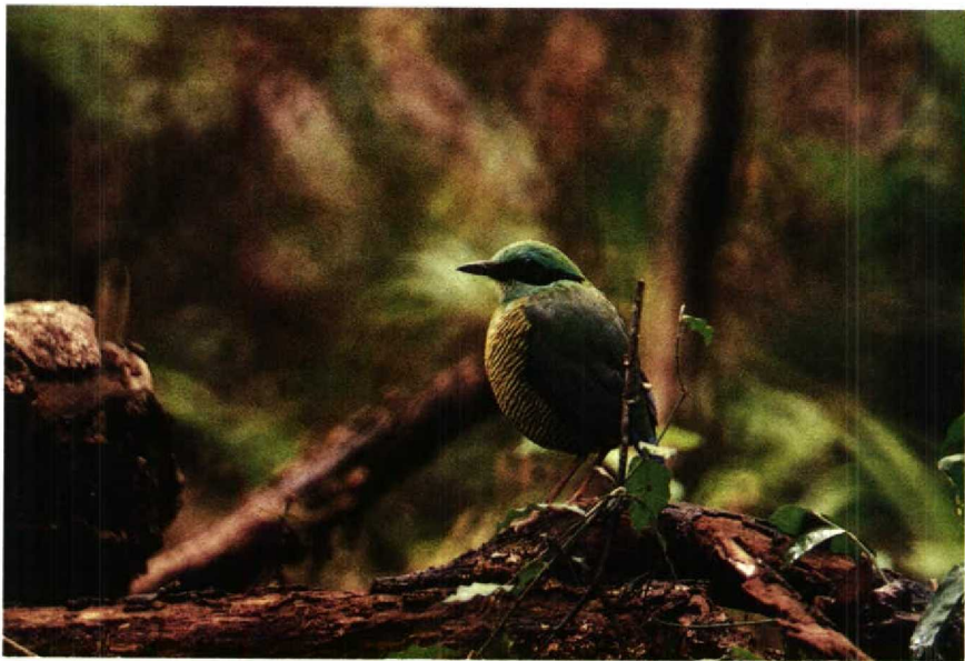
4 Elliot's Pitta ellioti , male, Kon Ha Nung forestry concession, Gia Lai-Kon Tum, Viet Nam, May 1988 (Frank G Rozendaal) 5 Elliot's Pitta ellioti , pair at nest, Kon Ha Nung forestry concession, Gia Lai-Kon Tum, Viet Nam, May 1988 (Frank G Rozendaal)