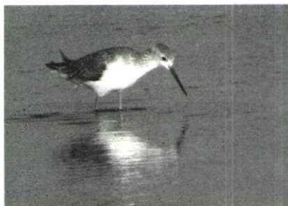
17 Ring-necked Duck Aythya collaris , Oued el Ouaar, Tarfaya, Morocco, January 1988 (Arnoud B van den Berg) 18 Marsh Sandpiper Tringa stagnatilis , Sidi Moussa, Morocco, December 1987 (Arnoud B van den Berg)

stagnatilis photographed on 26 and 27 December in the salines south of Sidi Moussa; and a Little Tern Sterna albifrons foraging on 16 January at Sidi Moussa (possibly the first January record for Morocco).