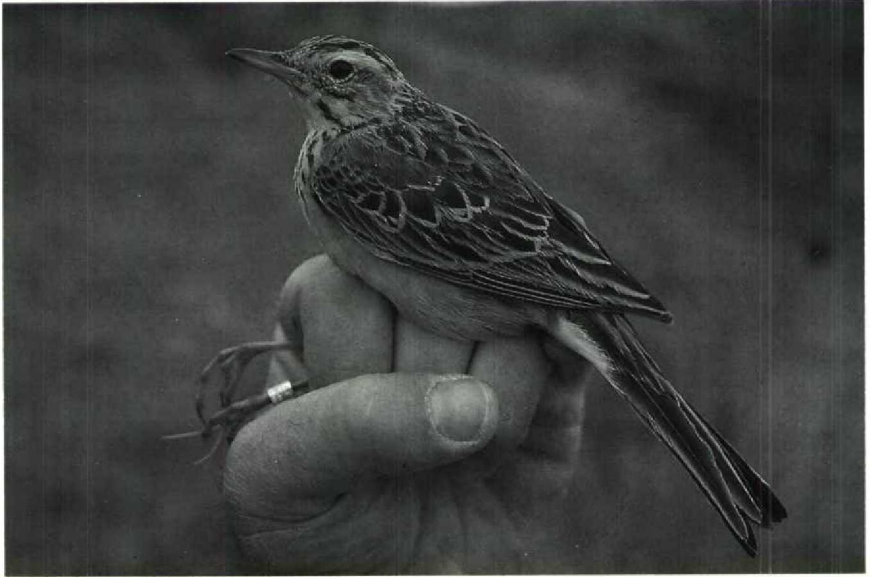
33 Grote Pieper Anthus richardi , Kennemerduinen, Noordholland, oktober 1988 ( Arnoud B van den Berg ) 34 Vale Lijster Turdus obscurus , Texel, Noordholland, oktober 1988 ( Arnoud B van den Berg )