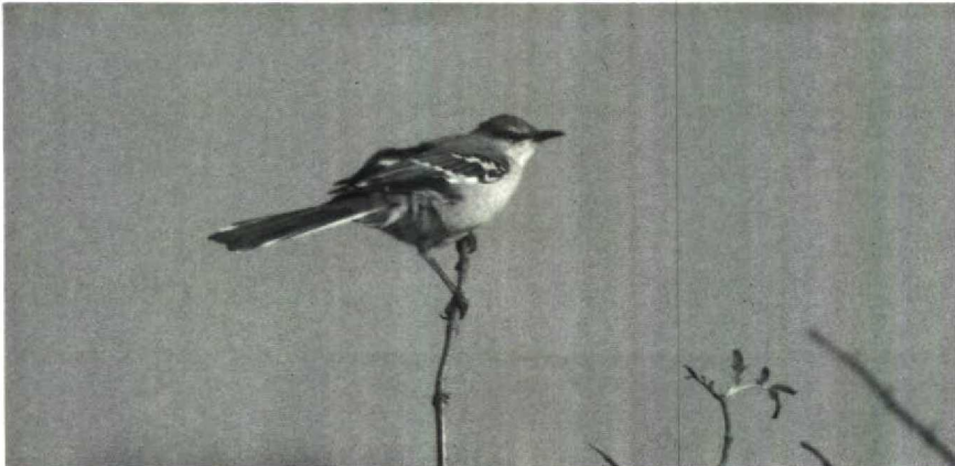
37 Spottlijster Mimus polyglottos , Schiermonnikoog, Friesland, oktober 1988

Oostende, tussen 16 en 30 oktober enkele op Texel, op 18 oktober een vondst bij Raversijde, op 26 en 27 oktober bij Ritthem Z, op 6 november bij den Oever en op 5 en 6 december bij Katwijk Zh. Na een lange aan-