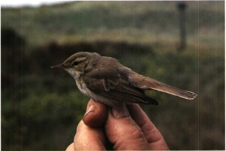
80 Kleine Spotvogel Hippolais caligata , Bloemendaal, Noordholland, september 1988

12:30 trof ik een kleine zanger aan in de bovenste baan van een mistnet tussen 2-6 m hoge wilgen en duindoorns. Vanwege het Fitis Phylloscopus trochilus -achtige voorkomen, het bleke uiterlijk, de achter het oog brede lichte wenkbrauwstreep, de witachtige staartzijde en de gladde licht rozeachtige poten kon de vogel onmiddellijk als Kleine Spotvogel Hippolais caligata worden herkend. De vogel werd geringd (Arnhem J04521), beschreven en gefotografeerd. Voordat de vogel om 14:00 bij het strandpaviljoen 'Parnassia' werd losgelaten, kon hij ook door de gewaarschuwde en tijdig gearriveerde Hans Schouten, Jan van Tussenbroek en Kees van Tussenbroek worden bekeken. De vogel vloog naar dicht struikgewas en liet zich urenlang niet meer zien. Om 17:30 waren er 12 vogelaars getuige van dat de vogel zich begon te verplaatsen waarbij hij even bovenin een struik, op de kale grond en op prikkeldraad ging zitten en enkele keren van struik naar struik vloog, om tenslotte na c 20 min over de duinen oostwaarts uit het zicht te verdwijnen. In zit vielen klein formaat en witte onderdelen op. In vlucht waren de bleke bruingrijze bovendelen, iets donkerdere lange staart en witachtige staartzijde opvallend. De onderstaande beschrijving werd van de vogel in de hand gemaakt.