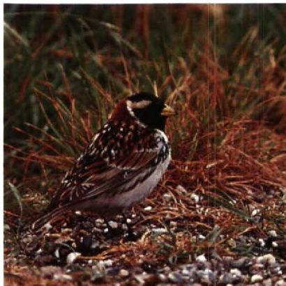
103 IJsgors Calcarius lapponicus , Putten bij Camperduin, Noordholland, juni 1989 (Hans Roersma)

lanceolatus bij Wageningen Gld op 10 en 11 mei werd korte tijd voor een Rosse Spotlijster Toxostoma rufum gehouden. Een Buidelmees Remiz pendulinus die op 30 april bij Schulen werd gecontroleerd bleek het vorig najaar als eerstejaars geringd te zijn bij Lier. Roodkopklauwieren Lanius senator waren er op 1 mei bij Blokkersdijk, op 10 mei bij Goudriaan, op 14 juni in het NP De Hoge Veluwe Gld en op 18 juni op Vlieland Fr. Een mogelijke Pallas' Roodmus Carpodacus roseus werd kort gezien bij Groningen. Van 18 mei tot in juni konden op enkele plaatsen in de Flevopolder weer Roodmussen C erythrinus waargenomen worden. Waarnemingen elders betreffen die van Texel op 21 en 27 mei, Den Helder