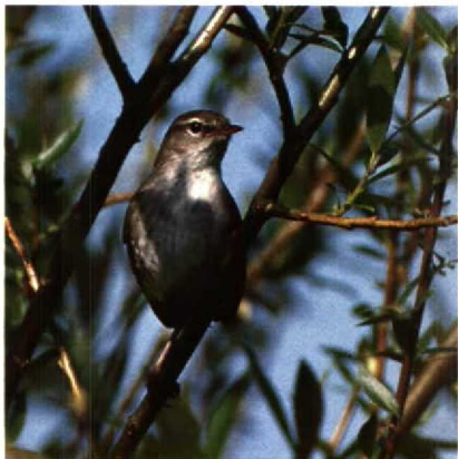
102 Cetti's Zanger Cettia cetti , Dordtse Biesbosch, Zuidholland, mei 1989