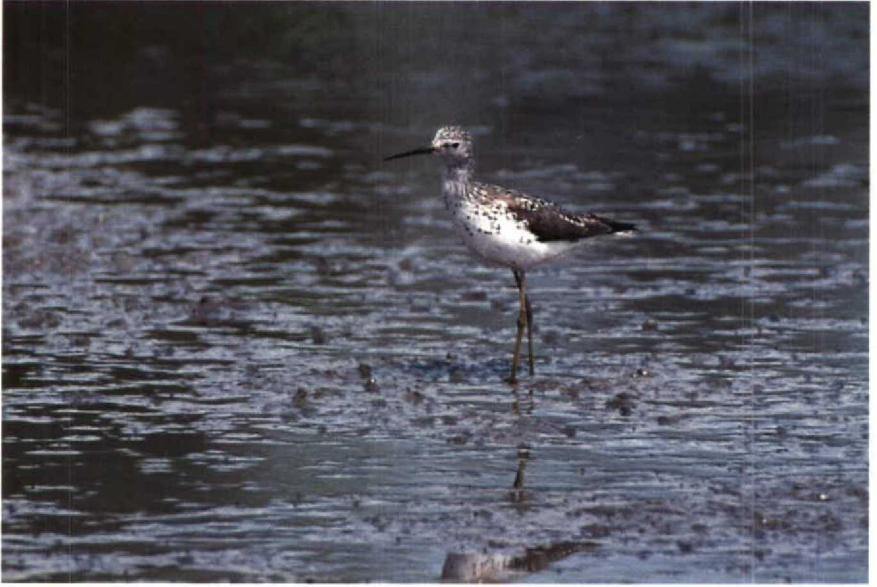
97 Poelruiter Tringa stagnatilis , Philipsdam, Zeeland, mei 1989 98 Woestijntapuit Oenanthe deserti , Oud-Alblas, Zuidholland, april 1989