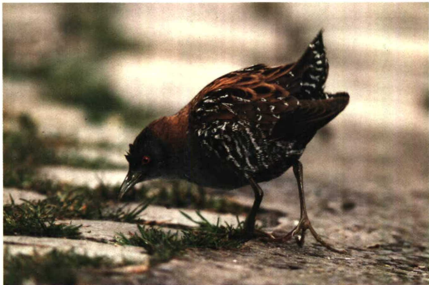
87 Baillon's Crake Porzana pusilla , Sunderland, Tyne and Wear, Britain, May 1989 88 Desert Wheatear Oenanthe deserti , Barn Elms Reservoir, Greater London, Britain, April 1989