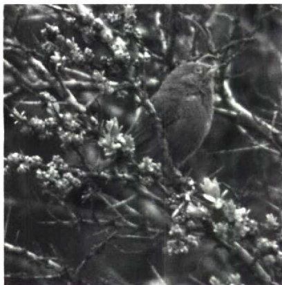
100 Provençaalse Grasmus Sylvia undata , Knokke, Westvlaanderen, mei 1989

mei en bij Goudriaan op 20 mei. Een Groenlandse Tapuit Oenanthe oenanthe leucorhoa werd op 27 april gemeld nabij de Cocksdoorp op Texel. Van geheel ander kaliber was de Woestijntapuit O. deserti die van 24 tot 26 april te bewonderen was in de polder bij Oud-Alblas Zh. Dit exemplaar was de tweede voor Nederland. Van 5 tot 7 mei zat er een mannetje Vale Lijster Turdus obscurus te Roermond L. Dit was het vierde geval voor Nederland. Een Cetti's Zanger Cettia cetti die van 2 tot 13 mei in de Dordtse Biesbosch zat kon, doordat twee excursies georganiseerd werden, door tientallen mensen gehoord worden. Op 16 juni was er één aanwezig in de AW-duinen. Op 14 juni werd een Veldrietzanger Acrocephalus agricola gevangen bij Veurne Wvl. Orpheusspotvogels Hippolais polyglotta zongen, buiten het normale verspreidingsgebied, bij Roisin Hg op 13 juni en bij Beloeil Hg op 25 juni. Op de Maasvlakte werd er op 21 mei één gevangen. De Provençaalse Grasmus Sylvia undata die zich op 1 mei in de 'Zwinbosjes' bij Knokke Wvl bevond was alweer de derde voor België. Bij Epen L werden tussen 28 en 31 mei één tot twee Bergfluiters Phylloscopus bonelli geobserveerd. Er zat van 24 tot 30 mei een Siberische Tjiftjaf P. collybita tristis te zingen bij