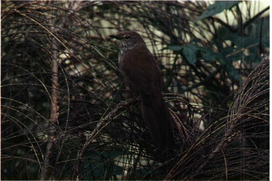
117-118 Java Russet Scrub Warbler Bradypterus seebohmi montis , Gunung Bromo, East Java, Indonesia, 2100 m, June 1989 (Frank G Rozendaal)