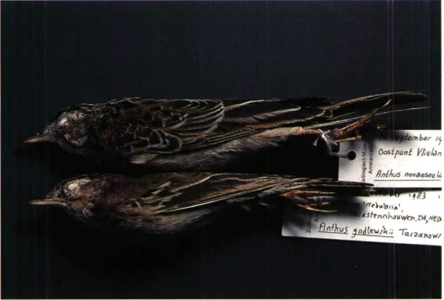
114 Blyth's Pipit Anthus godlewskii , first winter, November 1983 (lower), with Richard's Pipit A richardi (upper), collection ZMA (Arnouid B van den Berg) 115 Desert Warbler Sylvia nana nana , Amsterdamse Waterleidingduinen, Noordholland, November 1988 (Arnouid B van den Berg)