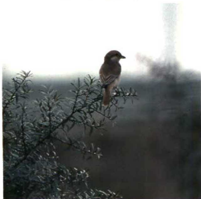
144 Izabelklauwier Lanius isabellinus , Zeebrugge, Westvlaanderen, september 1989