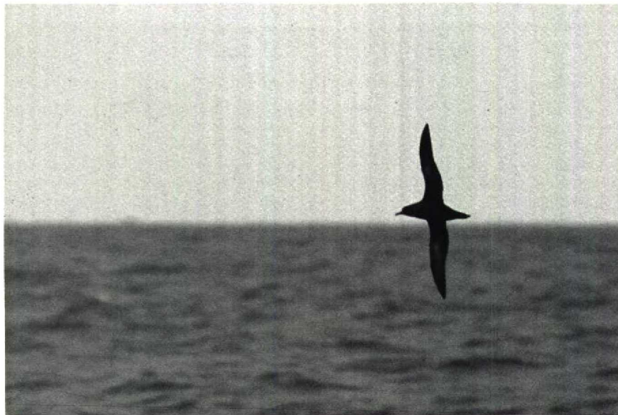
125 Grauwe Pijlstormvogel Puffinus griseus , 'pelagic trip' vanuit Lauwersoog, Groningen, september 1989 (Feike van Dijken)

L. melanocephalus lieten zich goed bekijken. De tweede tocht werd gekenmerkt door de vrijwel permanente aanwezigheid van Noordse Stormvogels Fulmarus glacialis . Dankzij een uitstekend lokmiddel ('chum') - het recept had men Peter Harrison weten te ontzutselen - konden enkele 100en Noordse Stormvogels (waaronder 'dubbel-donkere' individuen) naar de boot worden gelokt. Grauwe Pijlstormvogels vlogen de MS Lauwers aanvankelijk voorbij maar, nadat een netje met makreel-moten achter de boot was gehangen, werden de deelnemers ingewijd in het intieme leven van deze maritieme cosmopoliet. Kort daarop werden ze verrast door een majestueuze Middelste Jager S pomarinus (adult donkere vorm) en ook Grote Jagers kwamen zo nu en dan op het lokaas af. De derde tocht kwam geheel in het teken te staan van de waarneming van een 'Vaal Stormvogeltje' met een geheel donkere stuit. De voorlopige determinatie wijst in de richting van een Swinhoes Stormvogeltje O monorhis !