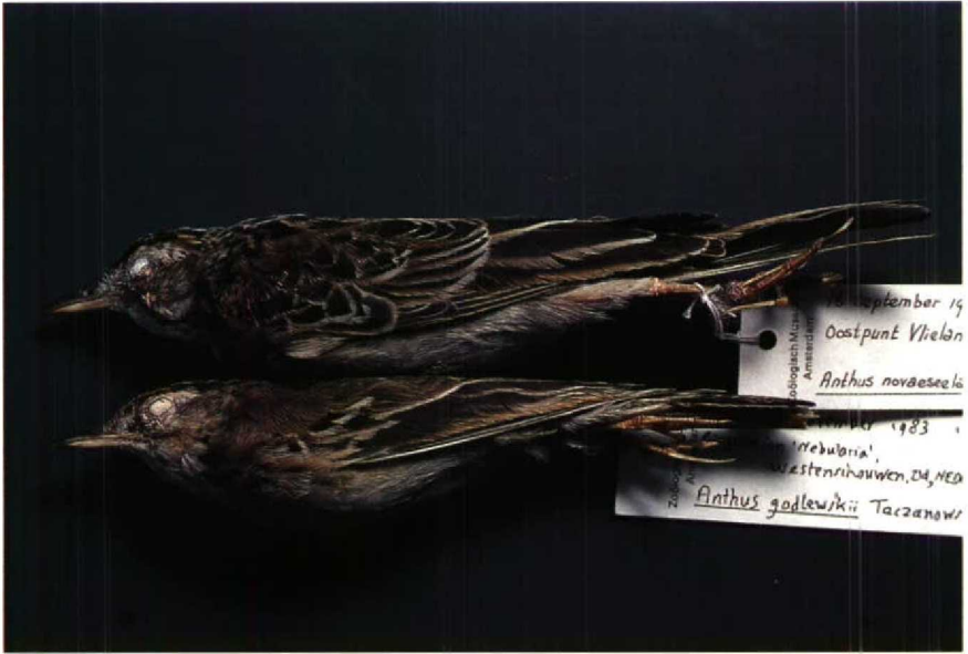
114 Blyth's Pipit Anthus godlewskii , first winter, November 1983 (lower), with Richard's Pipit A richardi (upper), collection ZMA (Arnouid B van den Berg) 115 Desert Warbler Sylvia nana nana , Amsterdamse Waterleidingduinen, Noordholland, November 1988 (Arnouid B van den Berg)