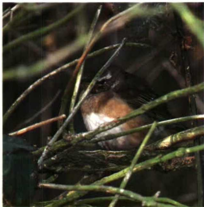
111 Eye-browed Thrush Turdus obscurus , Texel, Noordholland, October 1988 (Arnoud B van den Berg)

River Warbler Locustella fluviatilis 4,1 ZUIDHOLLAND Vlaardingen, 24-25 May, male, photographed and sound-recorded (W Breedveld, M Berlijn et al, van der Burg et al 1988, Lichtenbeld 1988). This is the 12th record for the Netherlands; all except the first three records were of singing birds in spring.