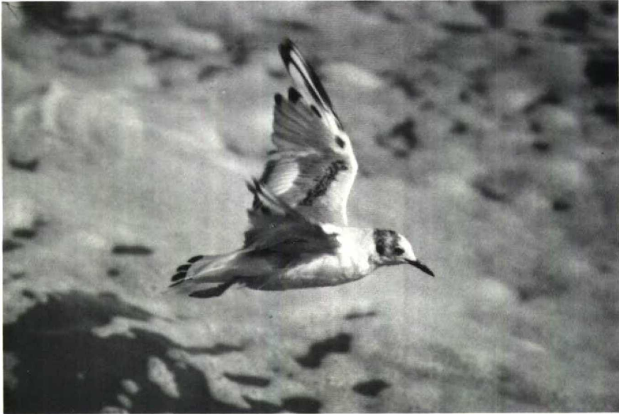
106 Kleine Kokmeeuw Larus philadelphia , IJmuiden, Noordholland, 9 juli 1988, ruiscore c 27 (Dieter Oelkers)

bruin met vrij brede witachtige rand; mogelijk één van tertials lichtgrijs. Grote en vermoedelijk meeste middelste dekveren egaal neutraalgrijs, ongeveer even licht als mantel. Kleine en vermoedelijk enkele middelste dekveren zwartbruin, zowel in zit als in vlucht opvallende diagonale armbaan vormend; diagonale armbaan duidelijk lichter (bruiner) dan zwartachtige partijen op handvleugel maar donkerder dan armbaan bij Kokmeeuw in eerste zomerkleed; in zit diagonale armbaan aan uiteinden breedst, in midden bijna onderbroken. Kleinste dekveren egaal lichtgrijs. Grote, middelste en kleine handdekveren wit; zwarte vlek op buitenste grote en middelste middelste handdekveren, daardoor buitenhand bonte aanblik gevend.