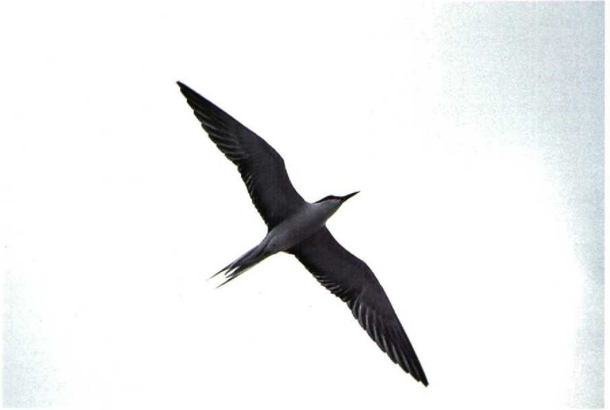
141 Brilsterne Sterna anaethetus , Terneuzen, Zeeland, juli 1989 ( René Pop ) 142 Brilsterne Sterna anaethetus , Philipsdam, Zeeland, juli 1989 ( Guus Hak )