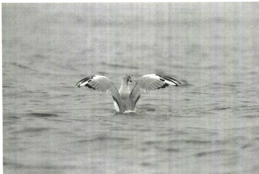
107 Kleine Kokmeeuw Larus philadelphia , IJmuiden, Noordholland, 20 juli 1988, ruiscore c 37 108 Kleine Kokmeeuw Larus philadelphia , IJmuiden, Noordholland, 8 augustus 1988, ruiscore c 44