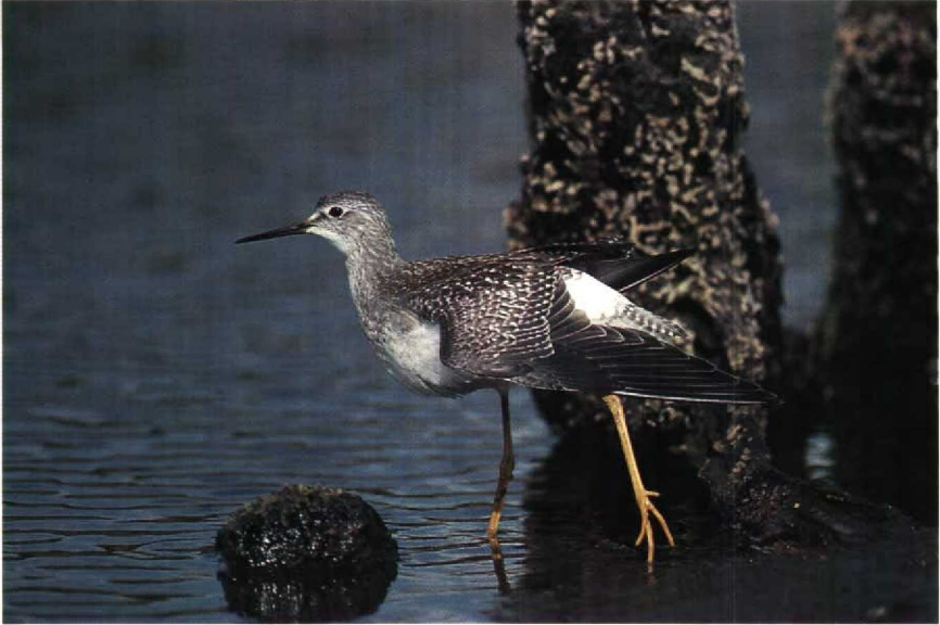
127 Lesser Yellowlegs Tringa flavipes , Drift Reservoir, Cornwall, Britain, August 1989 128 Blue-cheeked Bee-eater Merops persicus , Great Cowden, North Humberside, Britain, June 1989