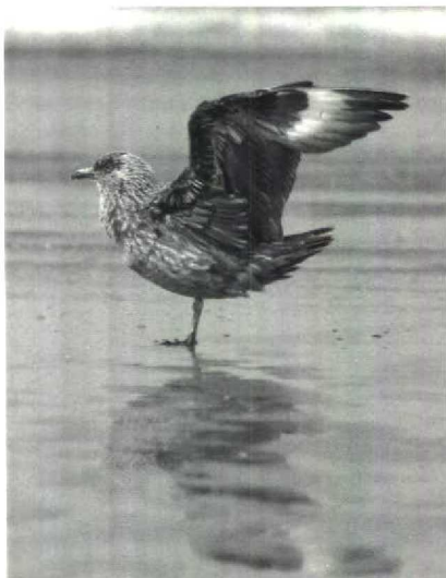
137 Grote Jager Stercorarius skua , adult, IJmuiden, Noordholland, augustus 1989 (René van Rossum)

Grauwe Franjepoten Phalaropus lobatus werden gemeld vanaf 22 juli, voornamelijk in het Lauwersmeer, Flevoland en in Zeeland. Op 30 september vloog bij Camper-