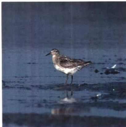
135-136 Siberische Strandloper Calidris acuminata , Philippine, Zeeland, september 1989

21 september bij Philippine. Breedbekstrandlopers Limicola falcinellus werden gemeld op 18 augustus bij Wissenkerke Z en op 26 augustus in het Lauwersmeer. Een zomerwaarneming van een Bokje Lymnocyptes minimus werd gedaan aan de Oostvaardersdijk op 22 juli. Een Poel-snip Gallinago media werd op 24 september kortstondig bij Zeebrugge geobserveerd. Een adulte Grote Grijs Snip Limnodromus scolopaceus werd op 27 juli gemeld in de Workumerwaard. Op 7 en 8 augustus zat een IJslandse Grutto Limosa limosa islandica in de Flaauwers Inlaag Z. Ook een groot aantal Poelruiters Tringa stagnatilis bereikte ons gebied. Vrijwel de gehele periode, tot 25 augustus en weer van 31 augustus tot 10 september, zat er één bij Kallo, op 4 juli bij de Vlinderbalg, op 4 en 5 juli langs de Oostvaardersdijk, op 7 juli op het Veerse Meer Z, op 16 juli op Texel, op 24 juli bij Sint-Philipsland Z, op 26 juli bij Nieuw Buinen, van 28 juli tot 20 augustus bij de Philipsdam, op 3 augustus bij Vlissingen, van 4 tot 6 augustus in het Lauwersmeer, op 7 augustus bij Harchies, op 27 augustus in de Oostvaardersplassen, op 5 september bij de Eemshaven en op 17 september op de Hellegatsplaten. Een Terekruiter Xenus cinereus werd op 22 juli gemeld langs de Knardijk. Tenminste 25