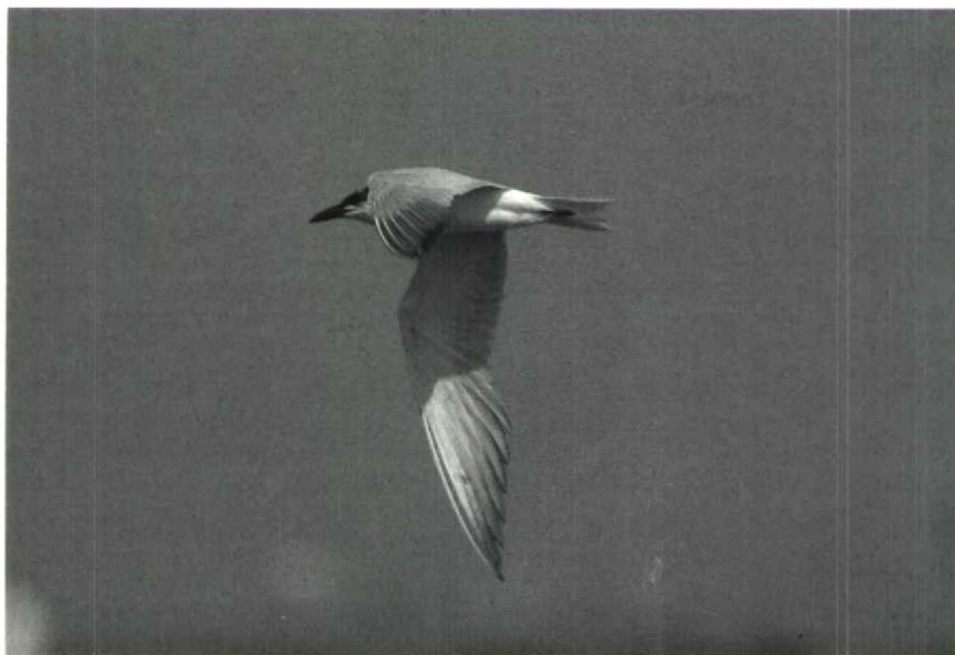
138 Lachstern Gelocheidon nilotica , Nieuwe Putten, Petten, Noordholland, augustus 1989

duin een Rosse Franjepoot P fulicarius langs. Op 27 augustus vlogen hier c 125 Kleine Jagers Stercorarius parasiticus langs. Een adulte Kleinste Jager S longicaudus vloog op 27 augustus bij Zeebrugge en op 29 augustus bij Westkapelle voorbij. Adulte Vorkstaartmeeuwen Larus sabini vlogen op 2 augustus langs Schiermonnikoog, op 15 augustus bij Katwijk en op 25 augustus bij Zeebrugge. Juvenielen verschenen op 30 augustus bij IJmuiden Nh en Zeebrugge, op 2 en 15 september bij Oostende, op 15 september bij Zeebrugge, op 17 september bij Camperduin en Scheveningen Zh en op 18 september bij Egmond aan Zee. Belangrijke aantallen Geelpootmeeuwen L cachinnans bleken aanwezig bij Terneuzen Z (in juli 35 à 40), bij Philippine (in september maximaal 30) en langs de Nederrijn Gld in augustus. Er waren gedurende de periode twee meldingen van Grote Burgemeesters L hyperboreus ; te Oostende op 31 juli en bij Zeebrugge op 27 augustus. Tussen 18 juli en 16 september