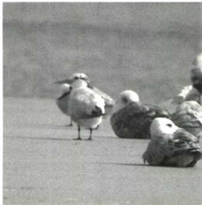
129 Royal Tern Sterna maxima , north of Agadir, Morocco, July 1988 (Arnold Meijer)

summer Sabine's Gull Larus sabini staying at Elat, Israel, from the last week of June to at least the end of July is worth mentioning. Three Royal Terns Sterna maxima were on a beach c 40 km north of Agadir, Morocco, on 14 July. Interestingly, an adult accompanied by a juvenile showed up at Tarifa, Spain, on 11 September. At Zeebrugge, Westvlaanderen, Belgium, an orange-