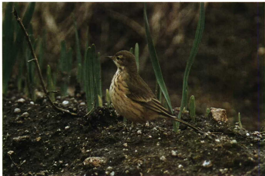
20 American Pipit Anthus rubescens , Isles of Scilly, Great Britain, October 1988 ( David M Cottridge ) 21 Northern Oriole Icterus galbula , Isles of Scilly, Great Britain, October 1988 ( Pete Wheeler ) 22 Red-eyed Vireo Vireo olivaceus , Isles of Scilly, Great Britain, October 1988 ( David M Cottridge )