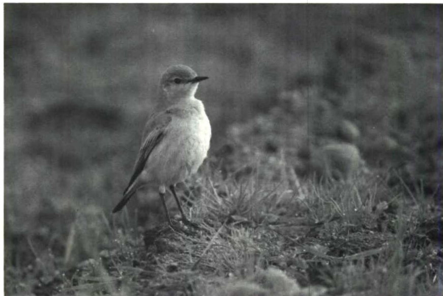
23 Isabelline Wheatear Oenanthe isabellina , Isles of Scilly, Great Britain, October 1988

ford Warbler Sylvia undata for 1988 was at Zeebrugge from 30 October to 1 November. A Desert Warbler S nana near Aerdenhout, Noordholland, from 30 October to 4 November excited 100s of Dutch and Belgian birders and was the first for the Netherlands. Up to five Azure Tits Parus cyanus were present at Kuhmo, Finland, from 27 November to at least 6 December. During September-October at least eight Red-eyed Vireo's Vireo olivacea were recorded in Britain and Ireland, and with two on St. Mary's on 10 October. On 7 October, Fair Isle produced a Blackburnian Warbler Dendroica fusca . This would be the first WP record of this warbler which breeds in eastern North America. A Northern Waterthrush Seiurus noveboracen-