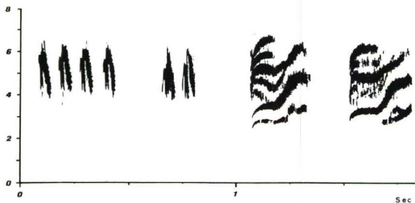
FIGURE 2 Flight chatters (A) and perching calls (B-C) of two Lesser Redpolls Carduelis flammea cabaret

The perching calls of Common Redpoll and Arctic Redpoll were even more different. One should, however, clearly distinguish between the perching call, which was frequently given by a perched bird to lure flying conspecifics to join it, and the rather similar alarm call, which seemed not to differ between Common and Arctic. The perching call had a complex structure. In Arctic, it was