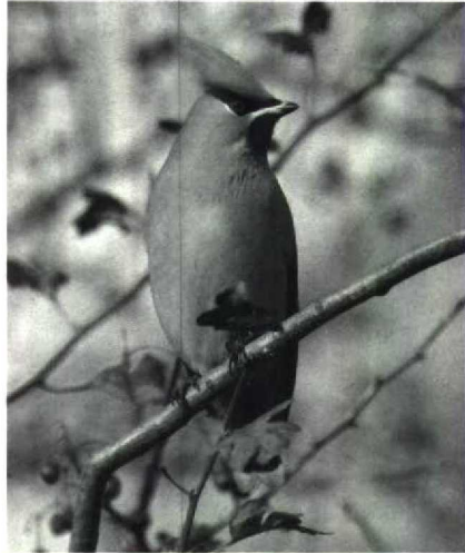
35 Pestvogel Bombycilla garrulus , juveniel, Schagen, Noordholland, november 1988 (Do van Dijck) 36 Pestvogel Bombycilla garrulus , Schagen, Noordholland, november 1988 (Do van Dijck)

plaren op 9 oktober, 12 en 22 november en 4 en 11 december. Op de Putten van Camperduin was er één van 9 tot 28 oktober en tussen 13 en 21 oktober zelfs twee. Overigens waren er meldingen op 10 oktober bij