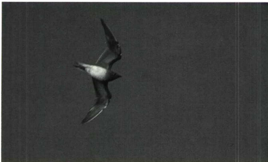
11 Vorkstaartplevier Glareola pratincola , Terneuzen, Zeeland, november 1987 (Hans Gebuis)

onderdekveren kastanjekleurig. Voorrand ondervleugel bruinzwart.