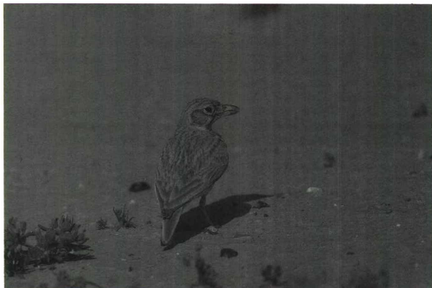
67 Dunn's Lark Eremalauda dunni , Arava valley, Israel, spring of 1989 (David M Cottridge)

less than 120 Houbara Bustards Chlamydotis undulata and six Arabian Bustards Ardeotis arabs were reported to be killed in the Merzouga area by Saudi Arabian falconers in December 1988. Three surviving Arabian Bustards were located in the area in early January, while another was spotted at Daya-el-Maïder on 1 January. At least 36 Great Bustards Otis tarda were assembling at Asilah Marsh in February; these birds probably belong to a small resident population in northern Morocco. On 14 March, in the Negev, Israel, a flock of 25 Caspian Plovers Charadrius asiaticus was sighted. The three Merja Zerga, Morocco, Slender-billed Curlews Numenius tenuirostris were reported to be present to at least 9 February, while at least one stayed until 11 March. An (oiled) Sabine's Gull Larus sabini flew past Oostende, Westvlaanderen, on 10 January, providing Belgium's first winter record. The long-staying Bonaparte's Gull L. philadelphia of IJmuiden, Noordholland, Netherlands, had