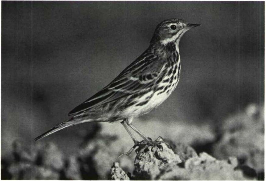
57-58 Red-throated Pipit Anthus cervinus , adult, Israel, November 1985