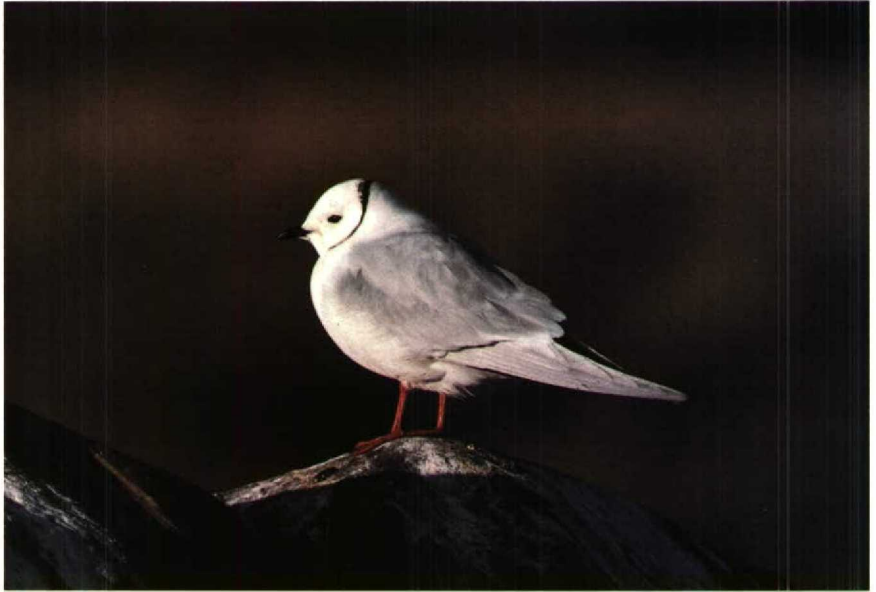
61-62 Ross's Gull Rhodostethia rosea , Churchill, Manitoba, Canada, July 1988 (Peter Scova-Righini)