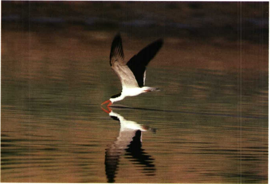
54 African Skimmer Rynchops flavirostris , Egypt, June 1987 (Rinie A van Meurs)

at Kom Ombo (Nico de Haan pers comm). Presumably, these records involve Sudanese birds dispersing northwards. The only known recent report from the Red Sea is of one bird at Hurgada on 15 May 1982 (Goodman & Meininger). I thank Peter Meininger for his help in preparing this note.