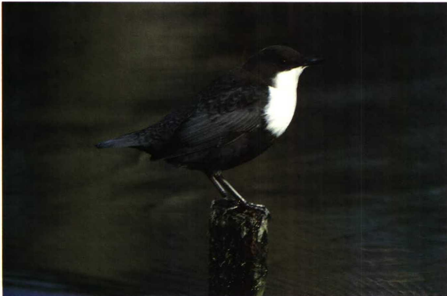
71 Waterspreeuw Cinclus cinclus , AW-duinen, Noordholland, januari 1989

den we hier dat op 23 december jl. een Oehoe Bubo bubo werd gevonden bij Berg en Terblijt L. Een Hop Upupa epops werd gezien op 28 maart in de Carnisse Grienden Zh. Op 27 maart werd een Grijskopspecht Picus canus gemeld bij Eupen Lk. Boerenzwaluwen Hirundo rustica poogden te overwinteren bij Nuland en bij Kortrijk Wvl (twee). Van 7 februari tot 30 april zat er een Grote Pieper Anthus richardi bij Breskens Z. In januari zat er een groepje van 80 Witte Kwikstaarten Motacilla alba alba , 10 Rouwkwikstaarten M. a. yarrellii en één Gele Kwikstaart M. flava bij Oostende. Pestvogels Bombycilla garrulus zaten 14 januari bij Haren Gr (max 27), tot 12 februari in Wateringen Zh (max vier), tot 4 maart bij Herentals A (max vier), op 2 en 3 januari bij Katwijk Zh (twee), op 23 januari bij Den Haag Zh, op 30 januari bij Schoorl Nh (twee) en van 1 tot 5 februari bij Gent Ovl (max zeven). Waterspreeuwen Cinclus cinclus waren aanwezig tot 5 maart in de AW-duinen Nh en tot 18 maart bij Velp Gld. Ver-