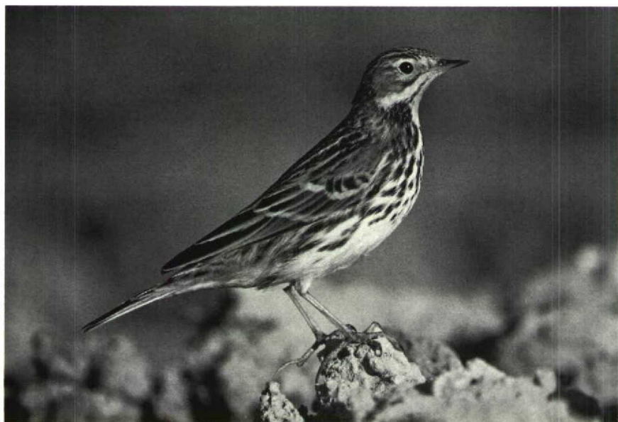
57-58 Red-throated Pipit Anthus cervinus , adult, Israel, November 1985