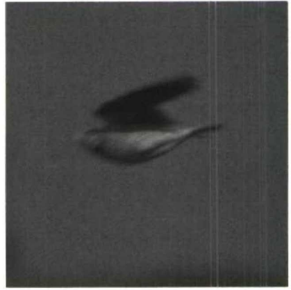
51-52 Kalanderleeuwerik Melanocorypha calandra , Texel, mei 1988

NAAKTE DELEN Iris donkerbruin. Snavel geelbruinachtig.