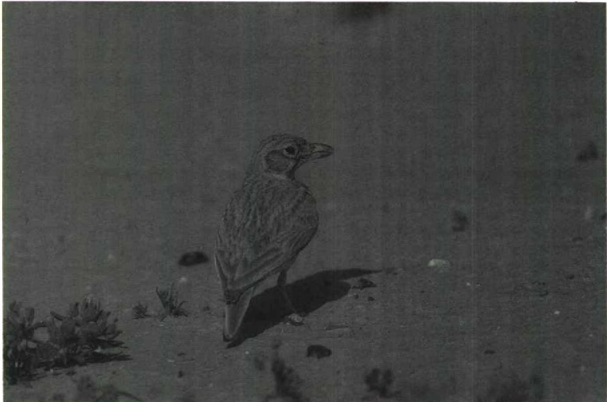
67 Dunn's Lark Eremalauda dunni , Arava valley, Israel, spring of 1989

less than 120 Houbara Bustards Chlamydotis undulata and six Arabian Bustards Ardeotis arabs were reported to be killed in the Merzouga area by Saudi Arabian falconers in December 1988. Three surviving Arabian Bustards were located in the area in early January, while another was spotted at Daya-el-Maïder on 1 January. At least 36 Great Bustards Otis tarda were assembling at Asilah Marsh in February; these birds probably belong to a small resident population in northern Morocco. On 14 March, in the Negev, Israel, a flock of 25 Caspian Plovers Charadrius asiaticus was sighted. The three Merja Zerga, Morocco, Slender-billed Curlews Numenius tenuirostris were reported to be present to at least 9 February, while at least one stayed until 11 March. An (oiled) Sabine's Gull Larus sabini flew past Oostende, Westvlaanderen, on 10 January, providing Belgium's first winter record. The long-staying Bonaparte's Gull L. philadelphia of IJmuiden, Noordholland, Netherlands, had