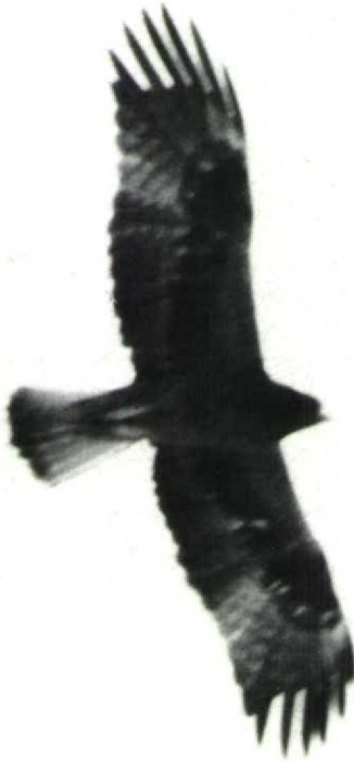
44 Booted Eagle Hieraetus pennatus rufous morph, Elat, Israel, March 1976 (Richard F Porter)

dian underwing-coverts and undertail-coverts similarly or even paler rufous. The greater underwing-coverts and under primary coverts were dark brown, forming a dark band across the underwing, a pattern similar to that of juvenile or immature Bonelli's Eagle H fasciatus . Head, upperparts, upperwing and tail were identical in all individuals, regardless of morph.