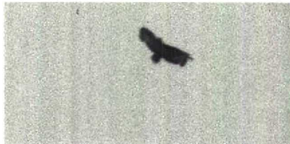
53 Bastaardarend Aquila clanga , Terschelling, Friesland, mei 1985