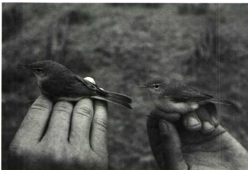
Mystery photograph 32. Solution in next issue