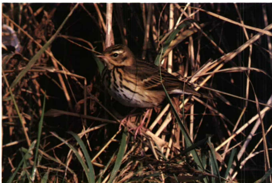
47 Siberische Boompieper Anthus hodgsoni , Texel, Noordholland, oktober 1987

KOP Voorhoofd, kruin en achterhoofd olijfgroen, kruin in lengterichting fijn zwart gestreept; zwarte wenkbrauwbevestiging. Wenkbrauwstreep voor oog warmgeel, boven en achter oog vrijwel wit; lopend van snavelbasis tot achter oorstreek, naar ach-