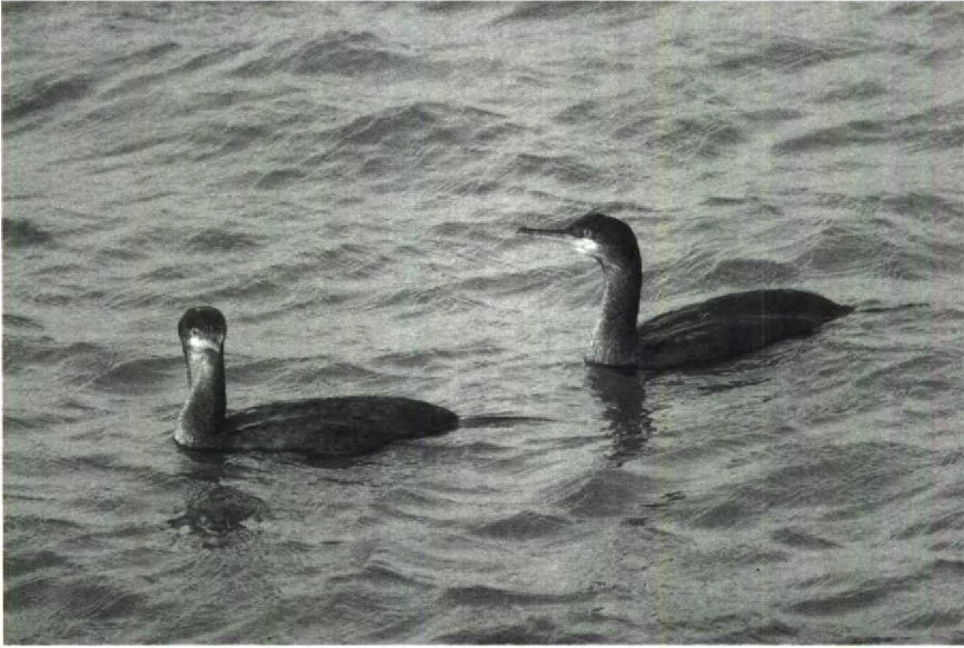
78 Kuifaalscholwers Phalacrocorax aristotelis , IJmuiden, Noordholland, februari 1990 79 Dwergganzen Anser erythropus , Strijen, Zuidholland, februari 1990