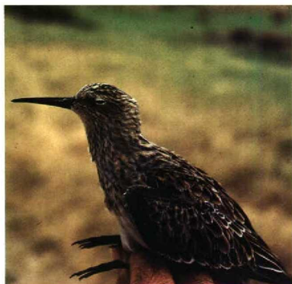
52 Calidris resembling C cooperi , adult winter plumage, Stockton, New South Wales, Australia, 21 March 1981

skinned, whereafter its size depends upon the skills of the preparator. Indeed, the holotype of C cooperi exhibits the long body, slender neck and bulged crop so commonly found in specimens of the last century. It was collected in 1833 and Baird, who lived from 1823 to 1887 (Mearns & Mearns 1988), could not have measured it before it was skinned. Its true size in life will never be known but can be judged by other repeatable measurements.