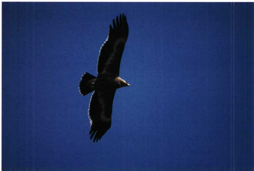
59-60 Steppe Eagle Aquila nipalensis , first-winter, Sekinchan, Selangor, Peninsular Malaysia, 19-20 February 1987 (Andreas J Helbig)