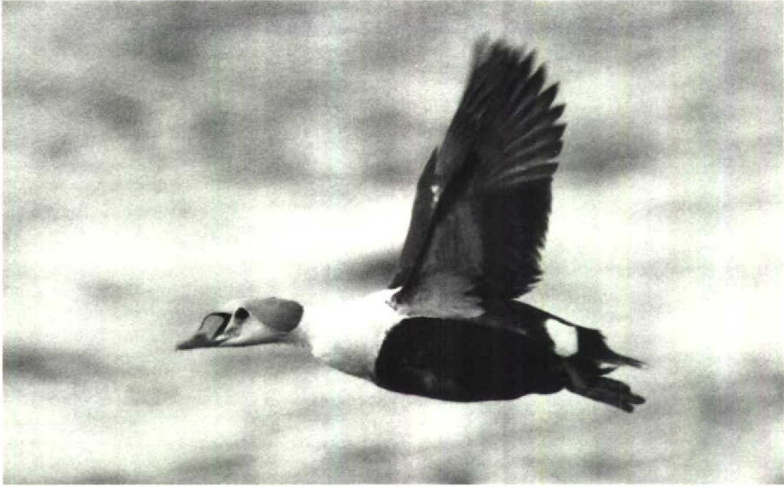
89 Koningseider Somateria spectabilis , Harlingen, Friesland, april 1990 90 Steppekievit Chettusia gregaria , IJsselstein, Utrecht, april 1990