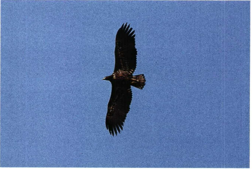
72 White-tailed Eagle Haliaeetus albicilla , Brabantse Biesbosch, Noordbrabant, Netherlands, January 1990 (René Pop) 73 Caspian Plover Charadrius asiaticus , Eilat, Israel, March 1990 (René Pop)