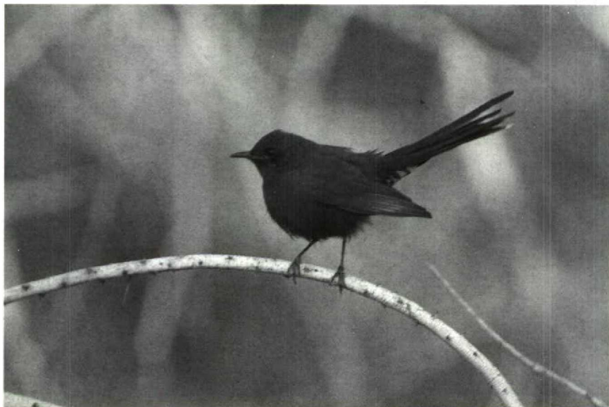
76 Black Bush Robin Cercotrichas podobe , Yotvata, Israel, April 1990 (David Cottridge)

World 3: 91-93, 1990). A very confiding first-winter Ivory Gull Pagophila eburnea attracted many birders to Stellendam, Zuidholland, during 9-19 February, being only the second record of this arctic species for the Netherlands. For the sixth winter in succession, an Oriental Turtle Dove Streptopelia orientalis remained at Mörbylånga, Öland, Sweden. In February-April, there was a remarkable influx of Great Spotted Cuckoos Clamator glandarius in Britain, with individuals in Cheshire (18 March), Devon (23 February and 20-29 March), Kent (25 March) and Sussex (4-30 April). A Scops Owl Otus scops found on a boat 3 km south of Portland, Dorset, Britain, on 20 March was transferred to Portland Bird Observatory, where it was released the same evening. It flew off, never to be seen again. The first Snowy Owl Nyctea scandiaca for the Netherlands since the winter of 1980/81 was photographed and seen by only a few birders at Lage Zwaluwe, Noordbrabant, on 2 March. About 15 Hawk Owls Surnia ulula were observed in Denmark last winter. A Needle-tailed Swift Hi-