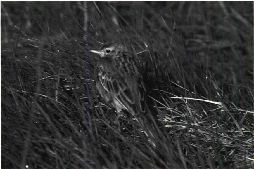
58 Grote Pieper Anthus richardi , Breskens, Zeeland, april 1988

ruï en leeftijd Adulte Grote Piepers ruïen volledig in het najaar; deze ruï vindt plaats in de periode van juli tot november, en wordt soms onderbroken en in de winterkwartieren voortgezet. In maart en april ondergaan adulte vogels een onvolledige ruï, waarbij een variabel deel van de lichaamsveren, kleine en (meestal) middelste vleugeldekveren, en meestal de middelste staartpennen vervangen worden. Juveniele vogels ruïen naar het eerste winterkleed in de periode augustus-september, maar de ruï wordt ook hier soms onderbroken en in het winterkwartier afgemaakt; deze ruï omvat lichaamsveren, vleugeldekveren (behalve de buitenste grote dekveren), enige tertials (soms alle) en de middelste (soms meer) staartpennen. De ruï van eerste winter- naar eerste zomerkleed is variabel, soms als adult, soms bijna volledig onderdrukt, waarbij zelfs oude veren uit het juveniele kleed niet geruid worden (Cramp 1988). De Grote Pieper van Breskens vertoonde nog kenmerken van het ju-