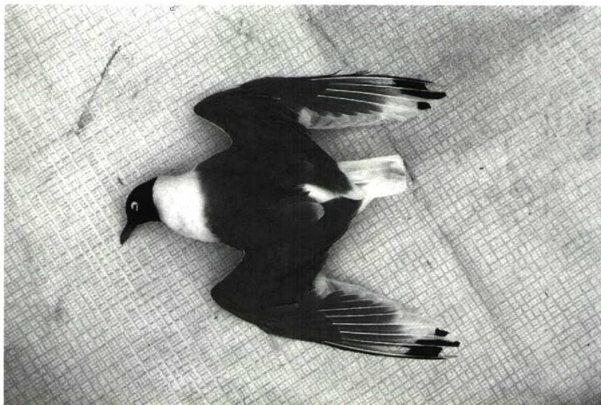
54 Franklins Meeuw Larus pipixcan , Friesland, juni 1988

GEDRAG In vergelijking met Kokmeeuw hogere vleugelslagfrequentie. Vlucht enigszins 'peddelend' (als bij Dwergmeeuw en Drieteenmeeuw Rissa tridactyla ). Met duidelijk gespreide poten op grond staand. Met ingetrokken hals en enigszins onvaste gang lopend. Herhaaldelijk koeien tot op enkele meters benaderend.