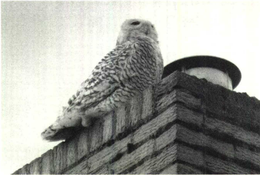
87 Sneeuwuil Nyctea scandiaca , Lage Zwaluwe, Noordbrabant, maart 1990 ( Ad Hoevenaar ) 88 Dwerggors Emberiza pusilla , Katwijk, Zuidholland, april 1990 ( Arnold Meijer )