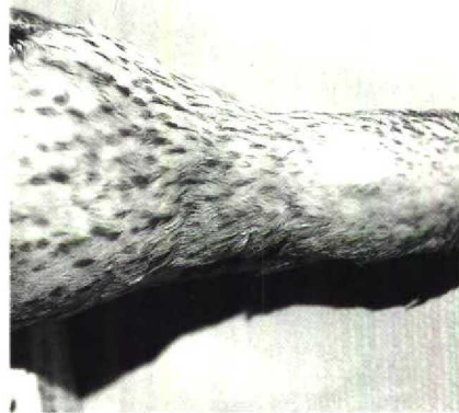
48 Calidris cooperi , moulting from winter to summer plumage, collected at Raynor South, Long Island, New York, USA, 24 May 1833

it was recognized as a possible hybrid but, if not, a chance existed that both could represent an undescribed species. They were also noted to have some features reminiscent of C cooperi and therefore were sent to the USNM for comparison with the unique holotype of C cooperi . However, the latter was found to differ from them by having a shorter and broader bill, a longer wing, a pattern of dark spots on a white background ventrally, white shafts on the primaries and whitish or buff edges to the tertials (R L Zusi in litt). As in C melanotos , the two Australian specimens have the streaked upperbreast demarcated from the white lower ventral area, rusty fringes to the tertials, and the upper surfaces of the primary-shafts are brownish except the 10th (outer) of which the shaft is white.