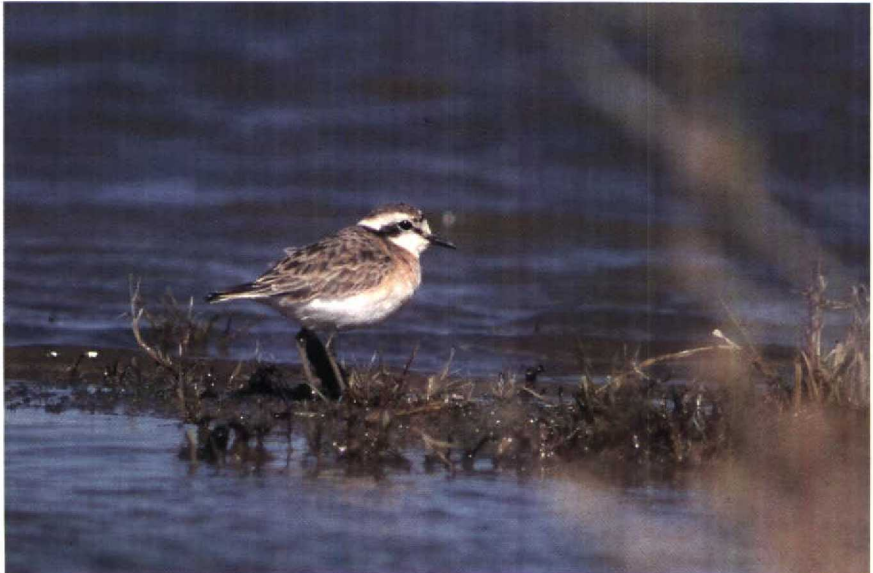
27 Kittlitz's Plover Charadrius pecuarius , Merzouga, Morocco, January 1990 (Arnold Meijer)