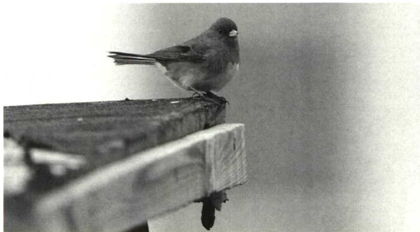
28 Dark-eyed Junco Junco hyemalis , Portland, Dorset, Britain, December 1989 (David Tipling)

ther on Fair Isle, Shetland, from 4 to 22 October. A Citrine Wagtail Motacilla citreola was recorded on Tresco, Scilly, Britain, on 2-5 October. An adult male Grey Hypocolius Hypocolius ampelinus was at Eilat from 21 November onwards, being the second Israeli record. In early December, 700 Grey Hypocolius were counted at three roosts in Bahrain. A Thrush Nightingale Luscinia luscinia found dead at Joinville, Haut-Marne, on 20 September was only the second record for France. The report of an Isabelline Wheatear Oenanthe isabellina on Endelave, Århus, on 21 September was a potential first for Denmark. A male Pied Wheatear O. pleschanka visited Fair Isle on 10-11 October. A Dusky Thrush Turdus naumanni eunomus was seen briefly at Helsinki, Finland, on 26 December. On North Ronaldsay, a Blyth's Reed Warbler Acrocephalus dumetorum was trapped on 3 October. In early November, a Desert Warbler Sylvia nana was on Langli, Ribe, another potential addition to the Danish avifauna. With records in Britain (two), Denmark (one) and Sweden (one) in November and December, Hume's Warbler Phylloscopus humei produced an interesting series. For a