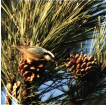
25 Red-breasted Nuthatch Sitta canadensis , Holkham Pines, Norfolk, Britain, October 1989 (David Cottridge)