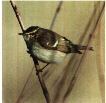
26 Hume's Warbler Phylloscopus humei , New Biggin, Northumberland, Britain, November 1989