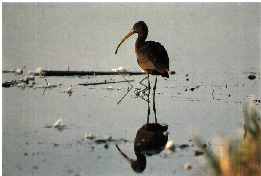
32 Zwarte Ibis Plegadis falcinellus , Nieuw-Lekkerland, Zuidholland, december 1989 33 Grote Burgemeester Larus hyperboreus , Brouwersdam, Zuidholland, oktober 1989