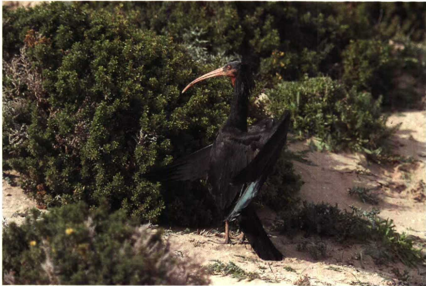
14 Bald Ibis Geronticus eremita , Tamri, Morocco, January 1990 (Paul Knolle)