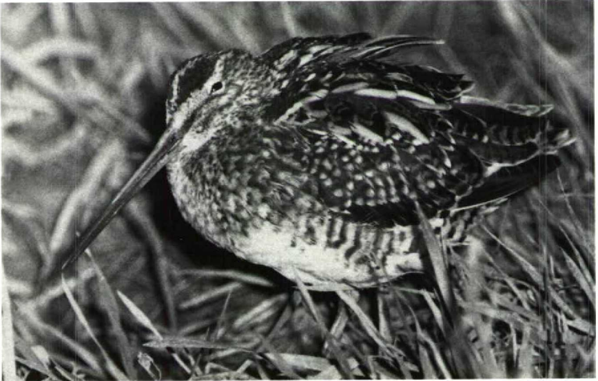
134 Snipe Gallinago gallinago , Randwijk, Gelderland, March 1990 (Arnaud B van den Berg)

Mystery photograph 37. Solution in next issue.