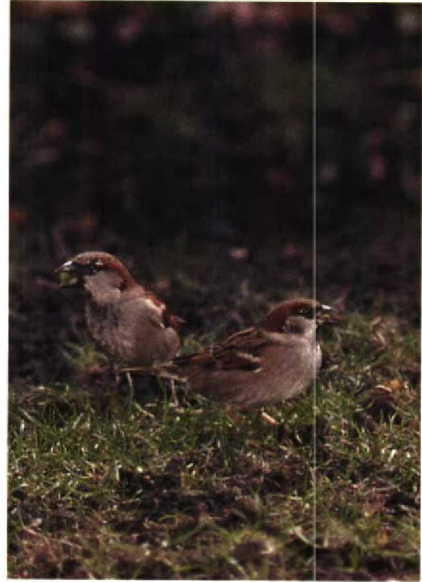
128-129 Hybride Huismus x Ringmus Passer domesticus x P. montanus , Aalsmeer, Noordholland, februari 1990

onder het zwarte 'slabbetje' bevonden zich slechts enkele donkere schubjes, kleine witte vlekjes waren aanwezig voor en achter boven het oog, er was een dun achterste vleugelstreepje en de donkere wangvlek was, hoewel niet zwart, iets contrasterender dan op Tucker's plaat. Geheel in overeenstemming waren een wit voorste vleugelstreepje, de bruine stuit, de zeemkleurige onderdelen en de niet in de nek doorlopende witte halsring.