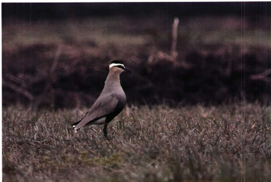
151 Steppiekievit Chettusia gregaria , IJsselstein, Utrecht, april 1990 (Paul Knolle)