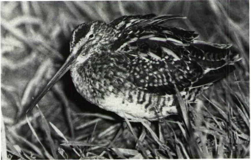
134 Snipe Gallinago gallinago , Randwijk, Gelderland, March 1990

Mystery photograph 37. Solution in next issue.