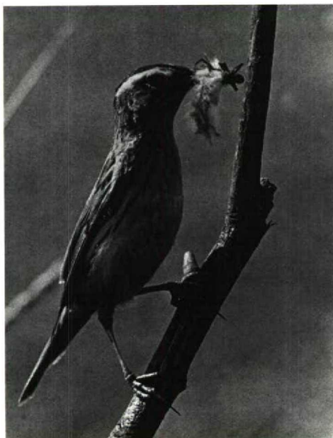
120 Aquatic Warbler Acrocephalus paludicola , Biebrza lowlands, Poland (Andrzej Balinski)

In comparison with other countries, the records of 181 lighthouse victims from the Netherlands are interesting as they give an indication of abundance earlier this century. They account for 30% of the total of Dutch records and occurred between 1887 and 1971, with 1912 (31) and 1936 (53) as peak years. Since 1950, only 20 lighthouse victims have been found. Both geographically (figure 1) and temporally