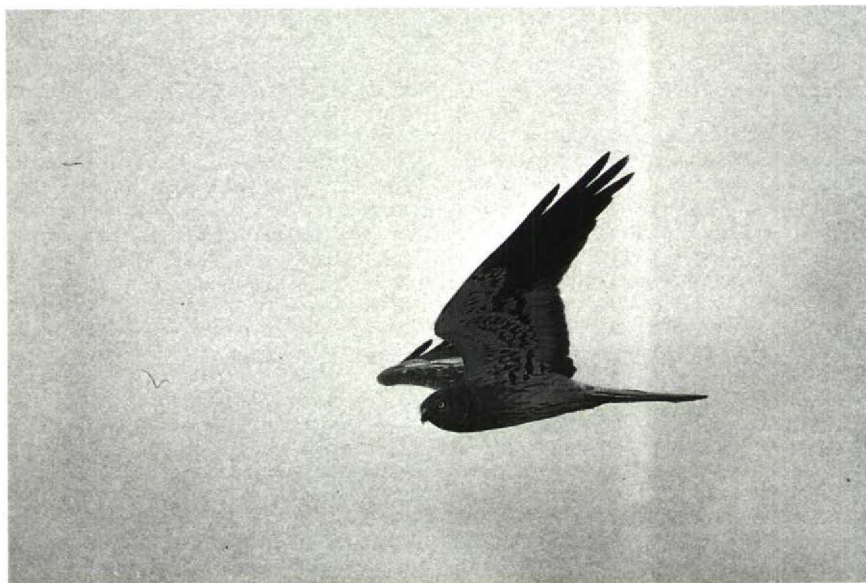
149 Grauwe Kiekendief Circus pygargus , Tureluurweg, Flevoland, juli 1990 (Lammert van der Veen) 150 Kwartelkoning Crex crex , Groningen, Groningen, april 1990 (Leo J R Boon)