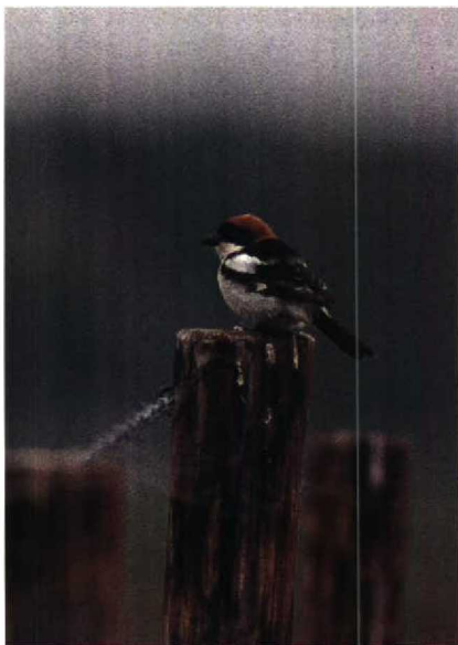
154 Krekelzanger Locustella fluviatilis , Brabantse Biesbosch, Noordbrabant, mei 1990 155 Roodkopklauwier Lanius senator , 's-Hertogenbosch, Noordbrabant, juni 1990 156 Struikrietzanger Acrocephalus dumetorum , Lelystad, Flevoland, juni 1990