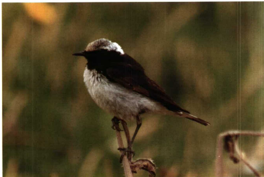
145 Pied Wheatear Oenanthe pleschanka , Newhaven, East Sussex, Britain, July 1990 ( Tim Loseby ) 146 Red-headed Bunting Emberiza bruniceps , Helgoland, Schleswig-Holstein, FRG June 1990 ( Frank Stühmer )