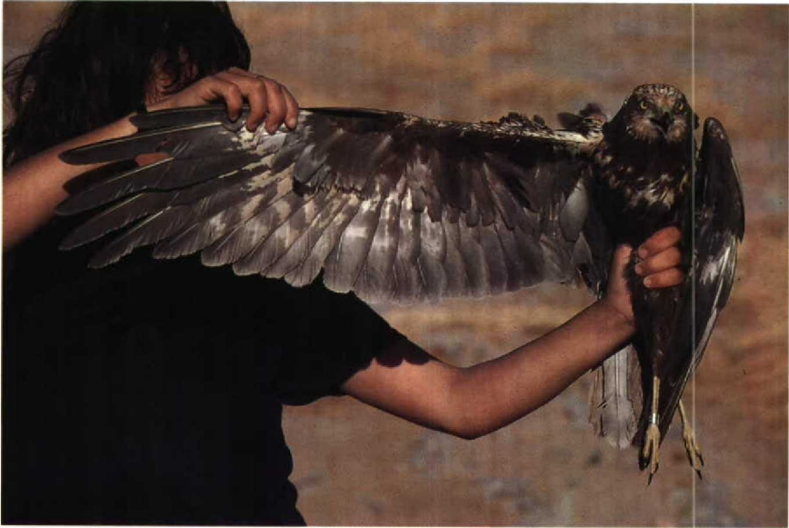
127 Marsh Harrier Circus aeruginosus , subadult male (same as plate 121), showing dark breast with pale patch (like adult female) and dark underwing-coverts. Note extensive whitish mottling on underwing. Eilat, Israel, April 1985

with 3-6 dark brown bands across each feather. This tail-banding has been illustrated (albeit on folded tails) and described by Forsman (1984). The iris colour is lemon-yellow like the adult male.