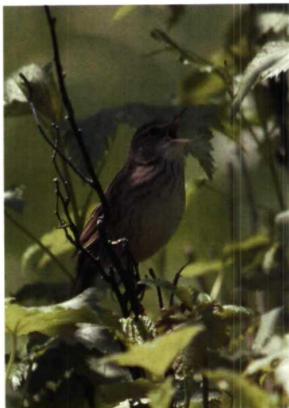
135-136 Lanceolated Warbler Locustella lanceolata , Irkutsk, USSR, June 1985 (Huub Huneke) 137 Pallas's Grasshopper Warbler Locustella certhiola , Bratsk, USSR, June 1985 (Huub Huneke)