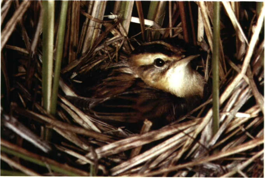
116-117 Aquatic Warbler Acrocephalus paludicola , Biebrza lowlands, Poland (Andrzej Balinski)