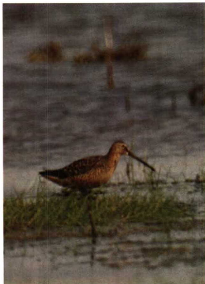
152-153 Grote Griuze Snip Limnodromus scolopaceus , Lauwersmeer, Groningen, mei 1990