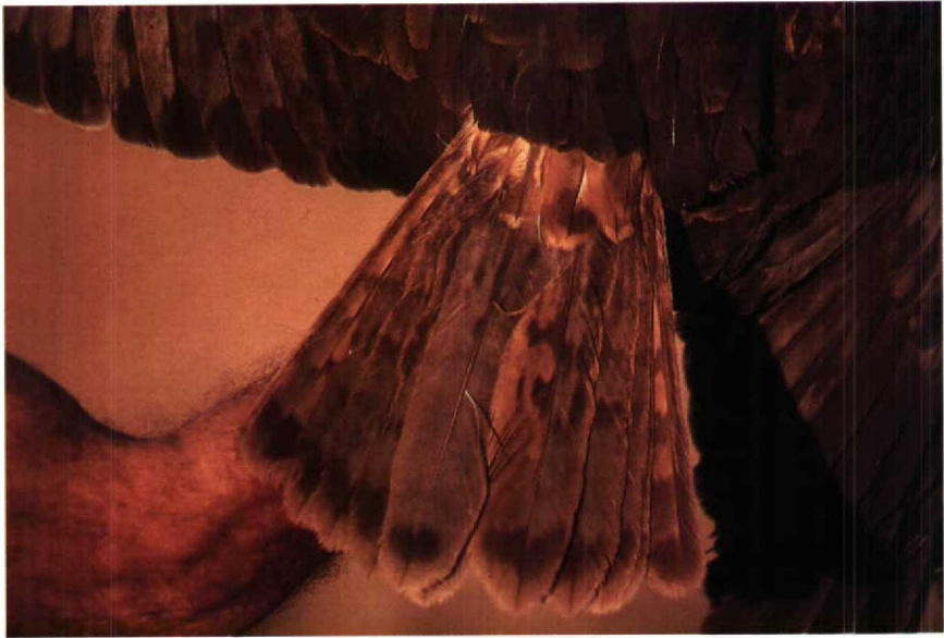
122 Marsh Harrier Circus aeruginosus , subadult male, showing rufous-and-grey coloration with dark subterminal tail band and faint banding. Eilat, Israel, April 1986

white illustrations. Here we describe the subadult male plumage in detail and using photographs of birds in the hand to illustrate plumage characteristics. The birds were captured at Eilat, Israel, as part of a study of raptor migration.