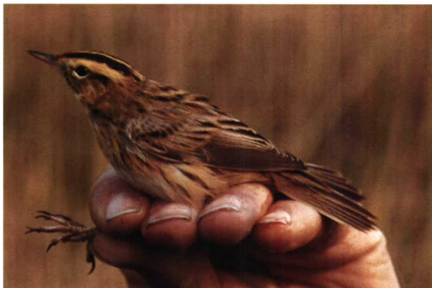
118-119 Aquatic Warbler Acrocephalus paludicola , Ruigoord, Noordholland, April 1978