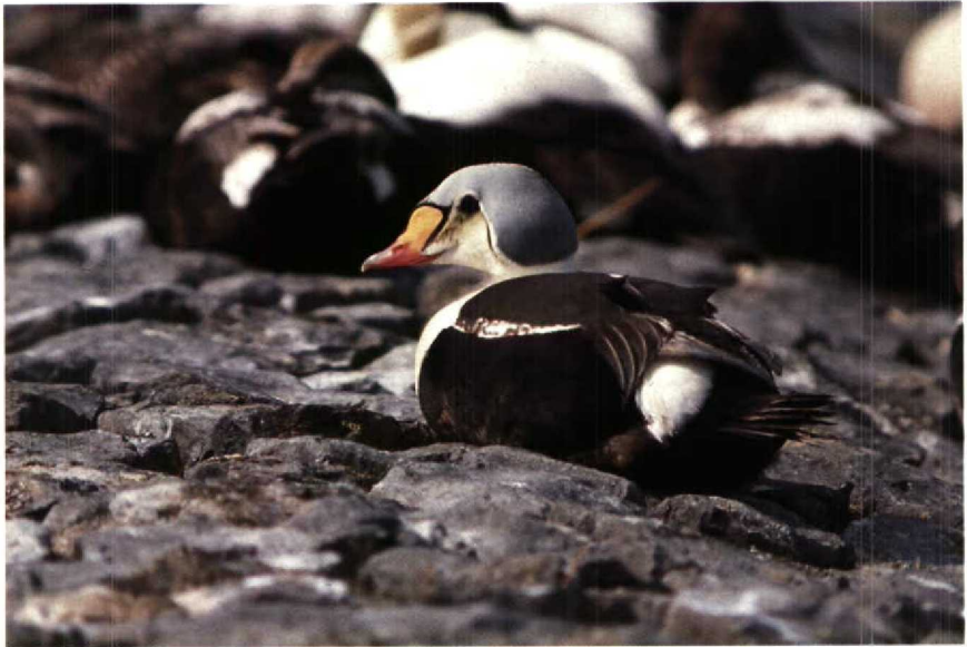
147 Koningseider Somateria spectabilis , Harlingen, Friesland (Allen Liosi) 148 Roodpootvalk Falco vespertinus , Zuidelijk Flevoland, Flevoland, mei 1990 (Allen Liosi)