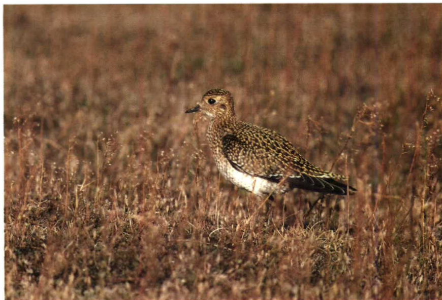
165 P. apricaria , Maasvlakte, Zuidholland, September 1990 (René Pop) 166 P. apricaria , Iceland, July 1985 (René Pop)