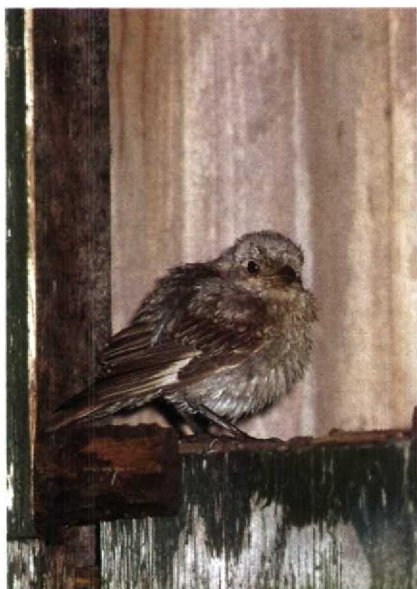
196 Roodkopklauwier Lanius senator , Texel, Noordholland, oktober 1990 (Arnaud B van den Berg)

vogelweek op Texel werd een mogelijke Kleine Spotvogel waargenomen bij de Vuurtorenweg. Sperwergrasmussen Sylvia nisoria waren er bij Oostvoorne Zh op 26 augustus, bij Castricum Nh op 27 augustus (vangst), op Ameland van 10 tot 12 september, in de Eemshaven op 17 september, op Terschelling op 27 en 28 september (ook gevangen), op Texel op 28 september, op Schiermonnikoog op 9 oktober (vangst) en in de Kennemerduinen op 12 oktober (vangst). Op 11 augustus werd een Grauwe Fitis Phylloscopus trochiloides geringd in de AW-duinen. Op Schiermonnikoog werd op 26 augustus één exemplaar waargenomen. Bij Castricum werd op 17 september een Swinhoes Boszanger P plumbeitarsus – nieuw voor Nederland – gevangen (zie plaat 183, p 261). Pallas' Boszangers P proregulus waren er op 23 oktober bij Katwijk en op 25 oktober op de Westplaat Zh. In de tweede helft van september en de eerste helft van oktober werden c 50 Bladkoningen P inor-