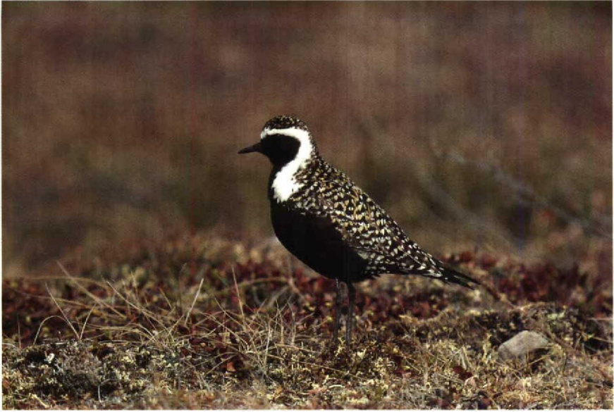
163 P dominica , Alaska, USA, June 1985 (Rinie van Meurs) 164 P fulva , Oahu, Hawaii, April 1989 (René Pop)