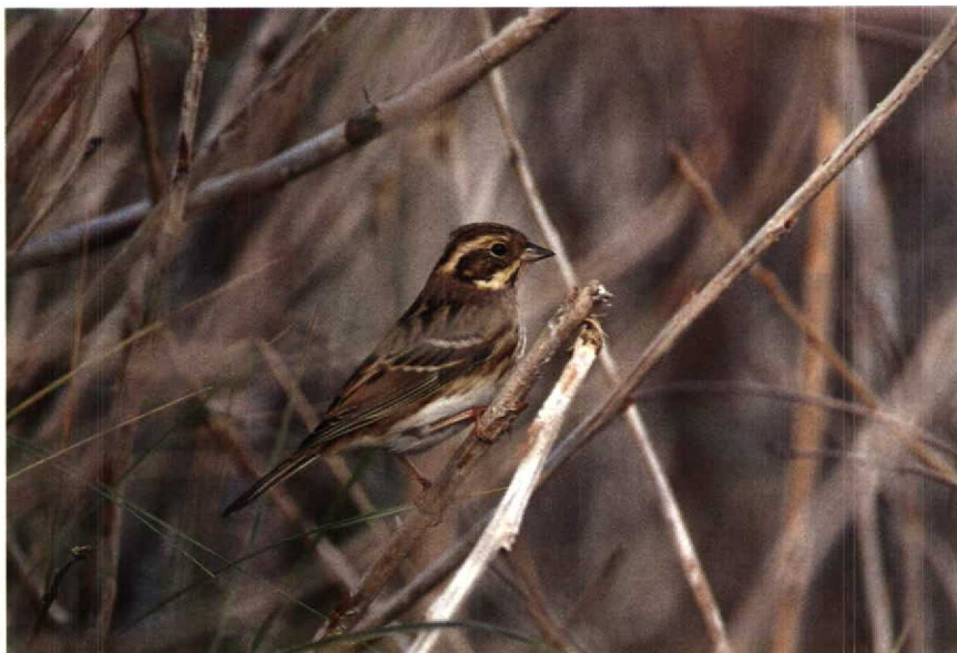
199 Bosgors Emberiza rustica , Westkapelle, Zeeland, september 1990 (René van Rossum) 200 Bosgors Emberiza rustica , Scheveningen, Zuidholland, september 1990 (Arie de Knijff)