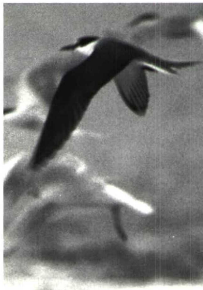
170-171 Brilsterne Sterna anaethetus , IJmuiden, Noordholland, juli 1989

Brilsterne, Bonte Stern S fuscata en Grijsrugsterne S lunata . De Bonte Stern verschilt van beide anderen door donkerdere bovendelen, met name mantel en nek, die niet opvallend lichter zijn dan de vleugels, en door een andere vorm van het wit op het voorhoofd. Dit reikt bij Bonte Stern niet in een punt naar achteren voorbij het oog zoals bij Brilsterne en Grijsrugsterne. De Grijsrugsterne, die in zijn verspreiding beperkt is tot het Pacifische gebied, lijkt sterk op de Brilsterne, doch verschilt vooral door nog lichtere mantel en rug en doordat alleen de buitenste staartpen wit is (Harrison 1983, 1987). Dit laatste is ook het geval bij de Bonte Stern maar de Atlantische ondersoort van de Brilsterne heeft meer wit in de staart.