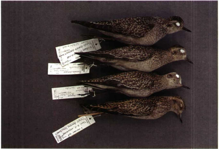
168 Juvenile P dominica (upper) and three juvenile P fulva, collected in the Netherlands during 1897-1916, Zoologisch Museum, Amsterdam, December 1989