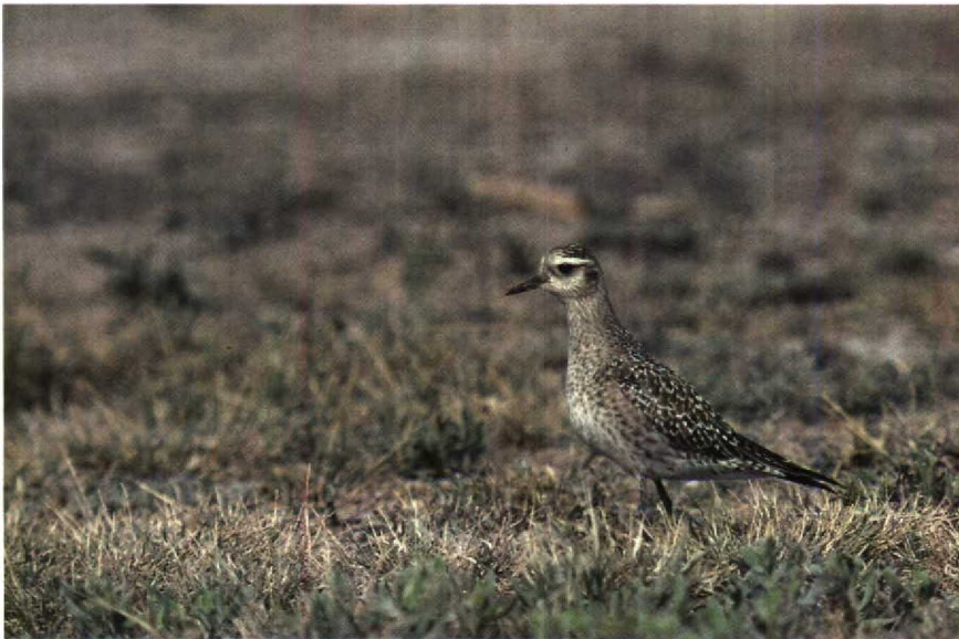
162 P dominica , Texas, USA, March 1982

According to Dunn et al (1987), P dominica and P fulva differ in the number of primaries exposed beyond the tertials, with four or five in P dominica and three in